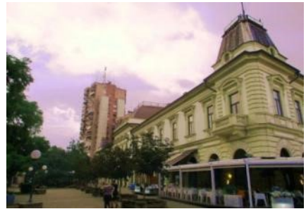
Слике 1 и 2. Супротни примери односа модернистичке новоградње током социјализма, на примеру потпуног уклапања у старо језгро Сремске Митровице (лево) и прављењу контраста у језгру Панчева (десно) (аутор: Б. Антонић)

Поред промене система одлучивања, велику улогу у обликовању локалне урбане политике имали су и други чиниоци. Послератне финансијске околности нису омогућавале да се локалне власти лако одрекну постојећег грађевинског фонда ради идеологије. Даље, велики притисак новодосељеног становништва са села у овом раздобљу додатно је тражио рационално коришћење постојећих стамбених простора у градовима. 18 На крају се испоставило да би рушење постојећих зграда било прескупо, па је у великој мери избегнуто идеолошки планирано уклањање старог ткива. 19