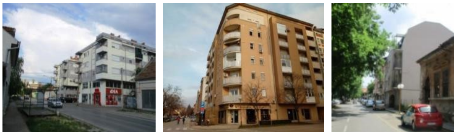
Слике 3, 4 и 5. Примери нових стамбених зграда у Зрењанину, Кикинди и Сомбору (аутор: Б. Антонић)

у великом раскораку с привредним суновратом на основу пропасти планске привреде, услед рата и пратећег економског ембарга. Ово се одразило и на градски простор; дошло је до раста без развоја, кроз ширење непрописно подигнутих стамбених насеља породичних кућа на ободима градова. 24 Старији средишњи делови градова су углавном таворили током 1990-их. Једино је дошло до појаве приватног сектора у трговини, али махом у виду ситне трговине, што је било у складу с првом фазом развоја тржишта других постсоцијалистичких градова. 25