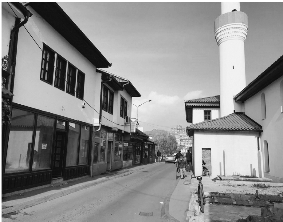
Слика 1. Постојеће стање центра старе чаршије Новог Пазара (аутор: Ајша Ђукић)

мери у односу на разговоре с институцијама), али и самим истраживањем. У фокусу овог рада су резултати истраживања контекста Новог Пазара. Разлог за одабир Новог Пазара пронази се у дугорочном и континуираном ангажовању једног од аутора у едукативним и институционалним структурама овог града, али и изузетне ангажованости и посвећености студената мастер студија који су спровели истраживање на локалу.