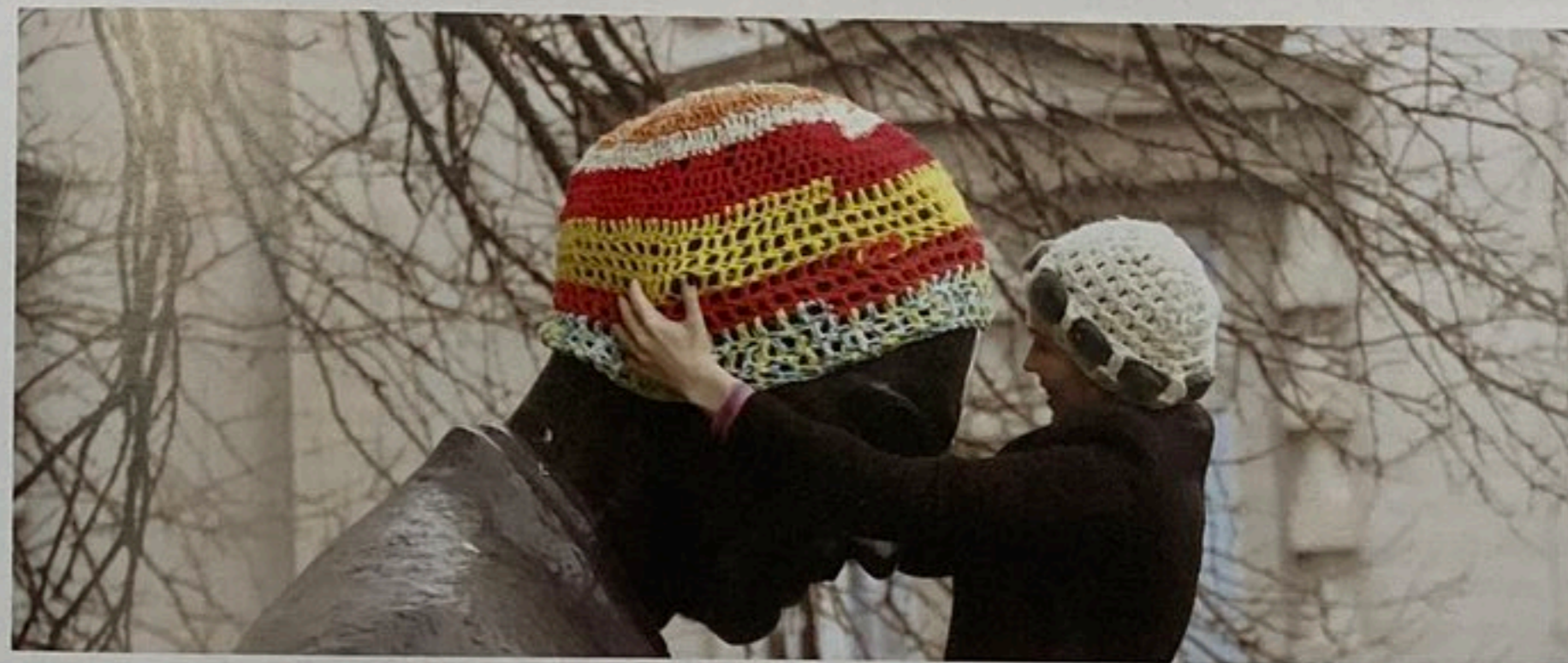
Слика 05: Сања Ђурић, Катарина Радичевић (2018), Пројекат и Фотографија © PaPs архива

Базирано на искуству стеченом кроз рад Public Art & Public Space (PaPs) програма Архитектонског факултета Универзитета у Београду, анализе контекста и могућности за партиципативну јавну уметност у Србији потврдили су да таква форма јавне уметности може значајно допринети одрживости градских простора на различите начине. Истовремено, анализе истичу да доприноси јавне уметности пракси креирања места остају ограничени, спорадични и привремени, у случају да јавна уметност није институционализована кроз програме и политике јавне уметности.