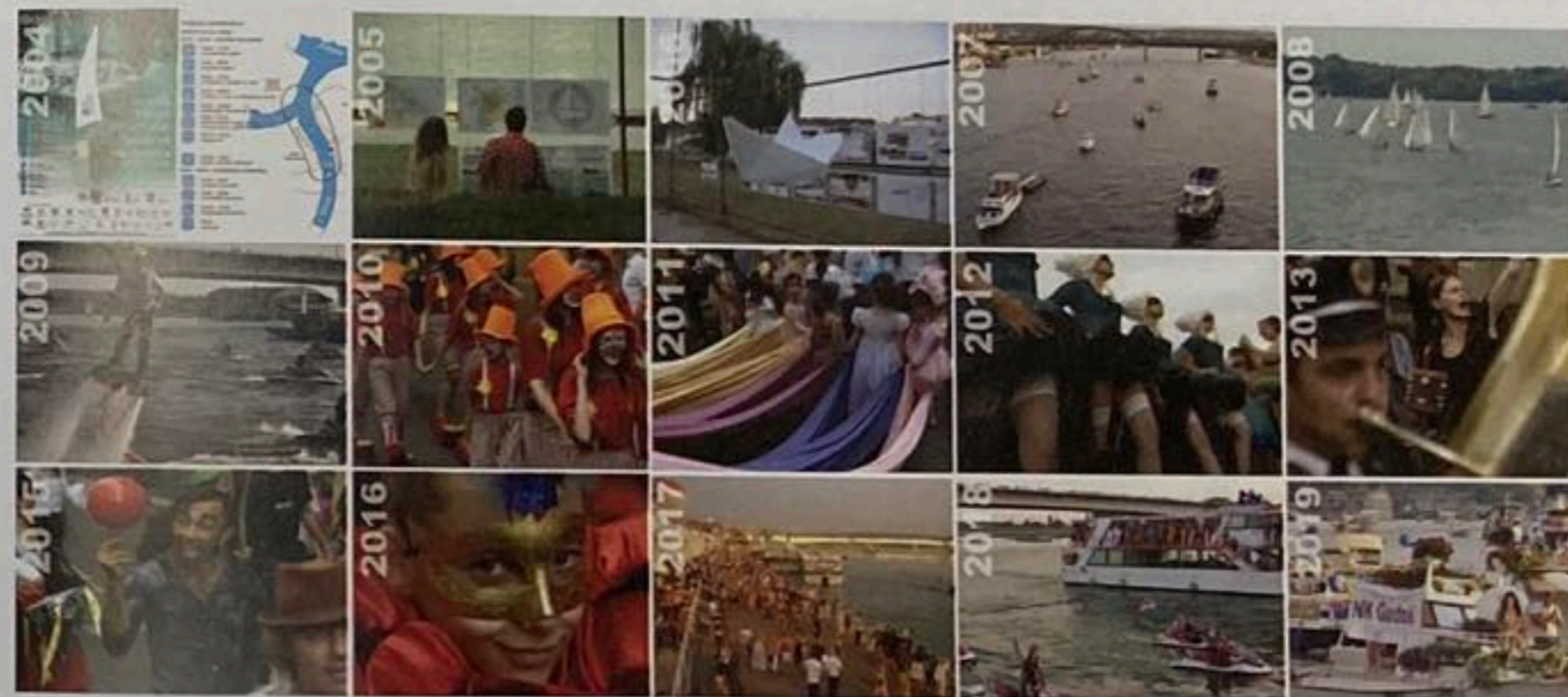
Слика 03: Београдски карневал бродова

Београдски карневал бродова драматично је повећао густину и диверзитет начина коришћења простора подручја приобаља и приказао могућности за даљи развој. Резултати оба PaPs -ова представљена пројекта приказани су на неколико националних конференција и изложби, пропраћени су широким интересом јавности и награђени са неколико награда и додатно, добили огроман медијски публицитет у земљи и иностранству.