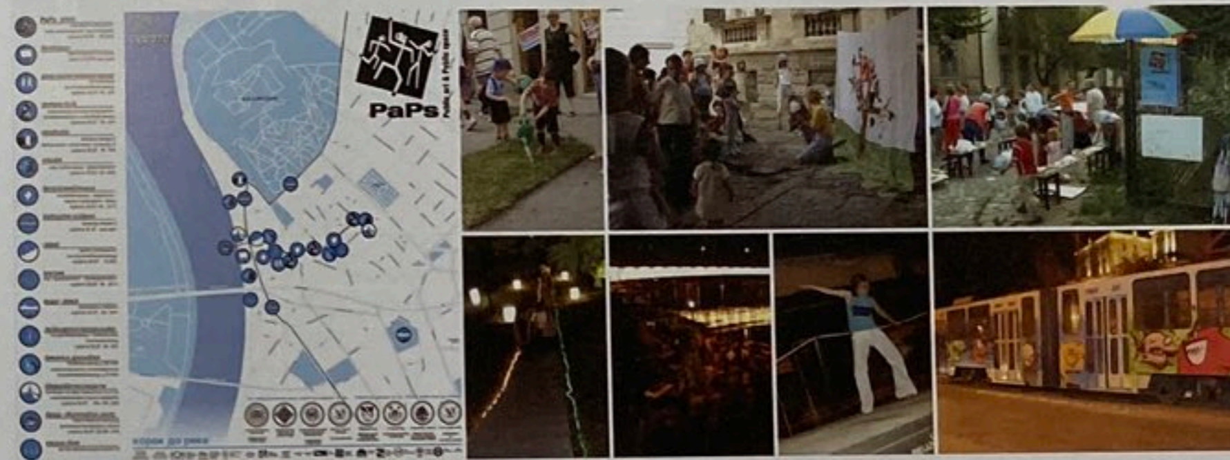
Слика 02: Корак ка реци, Фотографија © PaPs архива

Као резултат, PaPs је остварио политичку, институционалну и медијску подршку за свој наредни експериментални пројекат – „Београдски карневал бродова“. Њиме је требало да управљају студенти са претходно стеченим искуством, који би у новом циклусу учења постали тутори и менаџери пројекта.