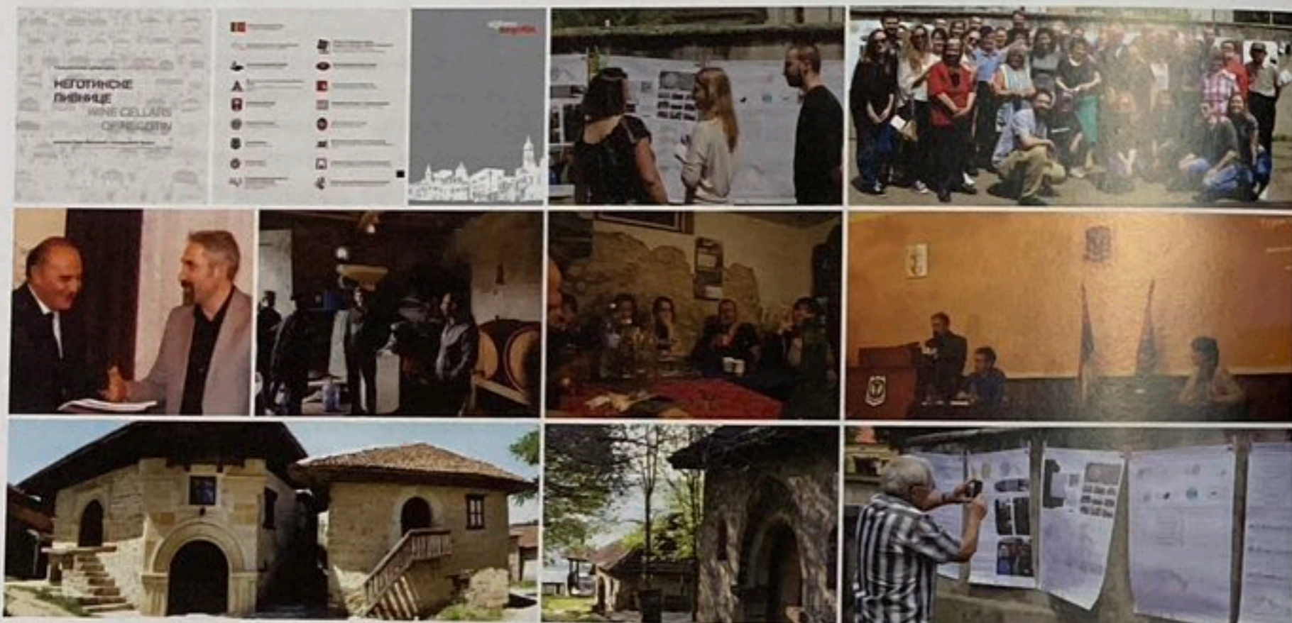
Слика 04: Досије Неготин

У периоду од 2020 до 2022 дошло је до разумљивог застоја у пројекту и активностима због ванредних услова пандемије COVID-а, али од 2022 године пројекат поново оживљава у правцу постизања неколико циљева будуће сарадње. Пружање "смерница" за стварање стратегија за оживљавање привреде у овој области је свеукупни циљ. Ревитализација винских подрума, који имају највећу културну и историјску вредност, али и највећу економску вредност, кроз различите стратегије и пројекте урбаног дизајна, може бити први и најважнији корак урбане обнове руралних подручја Општине Неготин.