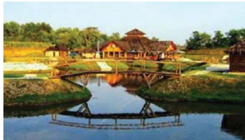
Слика 8: Аутентична кућа у веома познатом етно-селу Сирогојно музејског карактера (извор: www.serbia.com ); Слика 9: Етно-село „Моравски конаци“ новијег датума (извор: www.serbia.com ).

Етно-села јесу савремени чувари српске традиције и наслеђа, чија је главна улога оживљавање старог начина живота и обичаја из давнина. Она су, као весници традиционалног живота, често окружена бујном природом, а исто тако се обично налазе у близини историјских знаменитости и споменика културе. Чиста вода и ваздух, нетакнута природа, укусна храна, традиционални дух и атмосфера, као и гостопримство српских домаћина представљају окосницу ових места. Она пружају одмор и предах од стресног и ужурбаног градског живота кроз традиционалан и миран амбијент (www.serbia.com, 2020).