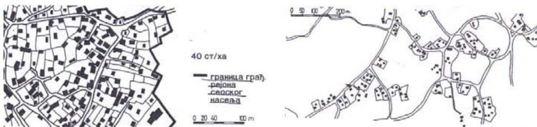
Слика 2: Потпуно збијено сеоско насеље Рајац код Неготина; Слика 3: Део полуразбијеног шумадијског насеља (извор: Симоновић и Рибар, 1993).

Код збијених насеља, разликују се два различита типа села: разређено збијени тип и потпуно збијена насеља. (Симоновић и Рибар, 1993).