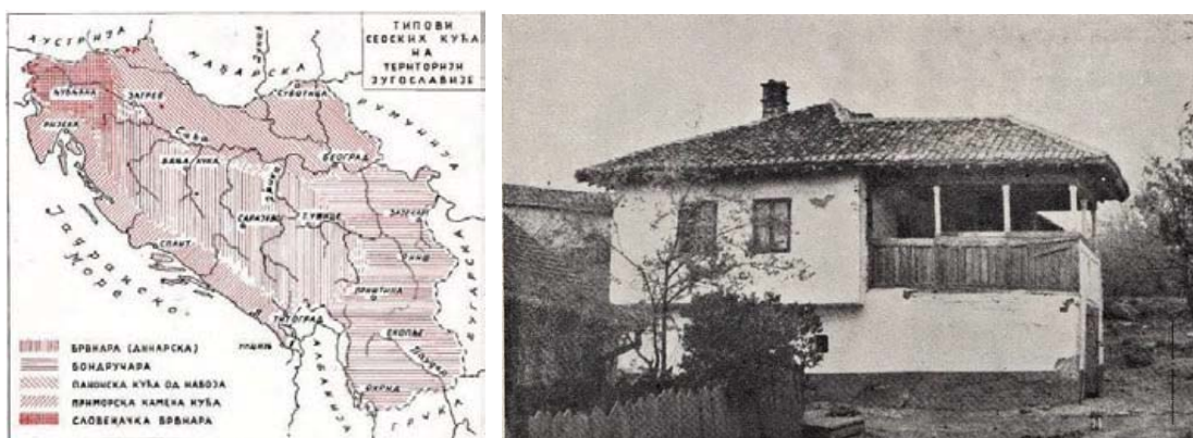
Слика 4: Типови сеоских кућа по разним крајевима Југославије; Слика 5: Већа сеоска кућа бондручара са подрумима и тремом – „доксатом“.

б.д.). То значи да су куће у овом региону имале слабију грађу, што је омогућило конструкцију од бондрука, или како сам назив налаже, реч је о „бондручарама“ (Дероко, 1964). Овакав тип конструкције куће је, поред брвнара, био најраспрострањенији у земљи (Павловић и др., 1987). Принцип бондручне конструкције се састоји од дрвеног скелетног система са испуном зидова од лакшег материјала, попут непечене опеке, тј. ћерпича, плетеног прућа облепљеним блатом или другим трошним материјалом (Дероко, 1964). Дрвени скелет куће се састојао од стубова и греда које су најчешће биле ортогонално постављене, са косницима који су служили за укрућење и преузимање дејства хоризонталних сила, одн. земљотреса и ветра и преносили их на тло. Зато се сматра да је овакав начин градње веома отпоран на земљотрес и друге природне непогоде (Бондрук конструкција, 2020). Кров се обично покрива ћерамидом, протежући се на подручја дуж речних долина и њихових падина оскуднијих шумом. (Павловић и др., 1987).