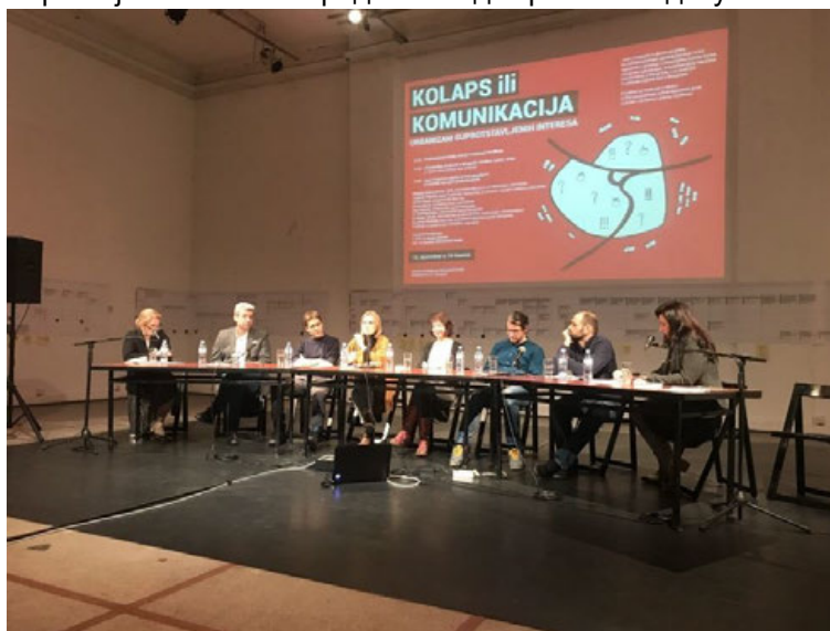
Слика 3: Фотографија са одржаног јавног разговора