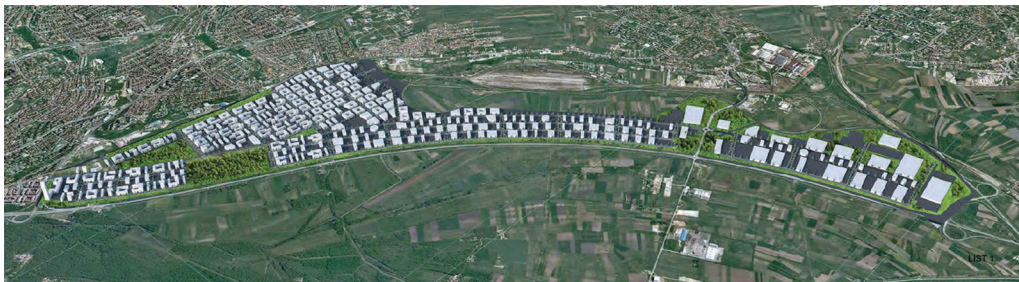
Slika 01: Prikaz vizuelizacije prvonagrađenog konkursnog rešenja