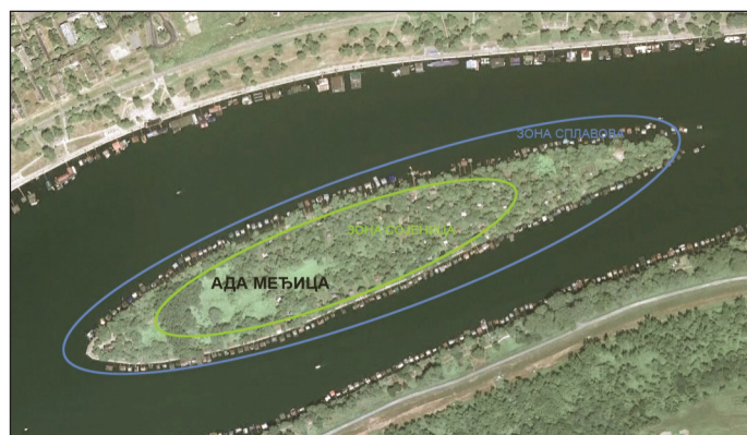
Сл. 4. Функционалне зоне Аде Међице: сојенице и сплавови