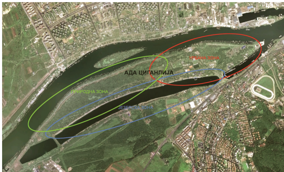
Сл. 2. Функционалне зоне Аде Циганлије: урбана, природна и зона језера. Fig. 2. The aerial view of Ada Ciganlija and its urban, natural and lake zone.

Атрактивност простора довела је и до уплива конзумеризма који потенцијално угрожава стање животне средине, посебно у ситуацији када већина корисника овог простора нема развијену свест о сопственој улози у процесу очувања постојећих природних вредности, већ сматра да о томе бригу води неко други.