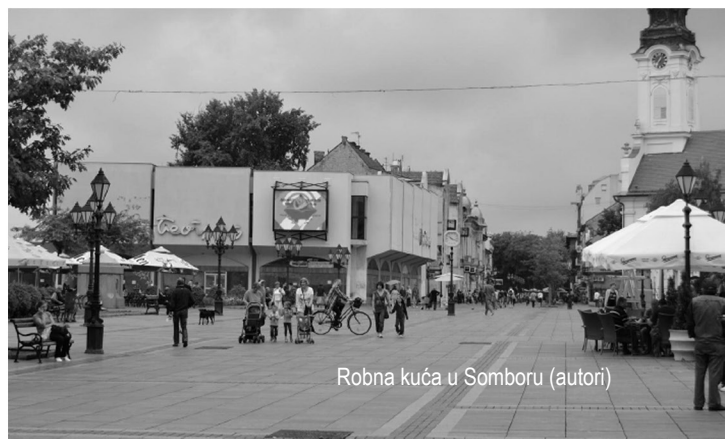
Robna kuća u Somboru (autori)