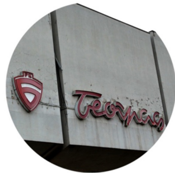
Detalji fasade robnih kuća u Vranju, Jagodini i Beogradu (autori)