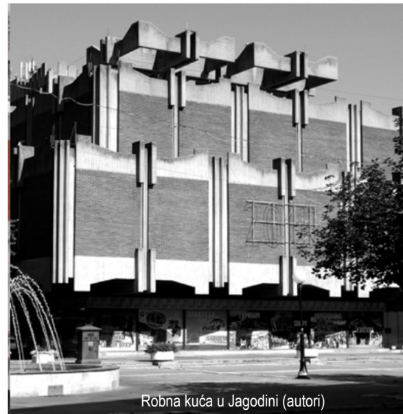
Robna kuća u Jagodini (autori)