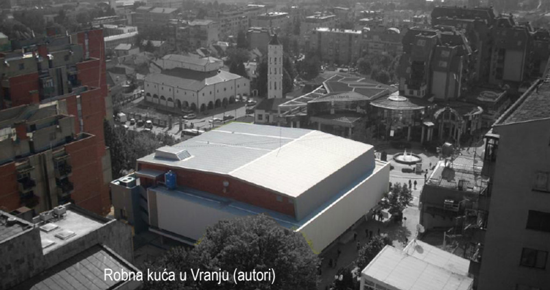
Robna kuća u Vranju (autori)