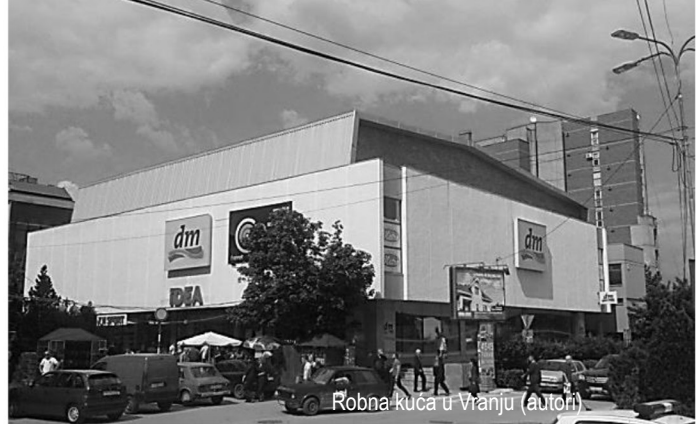
Robna kuća u Vranju (autori)