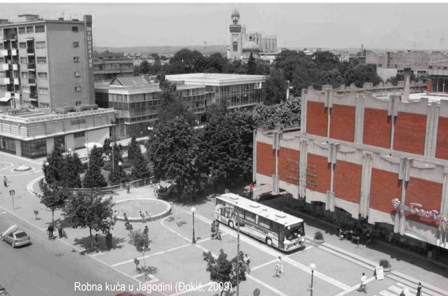
Robna kuća u Jagodini (Đakić, 2009)