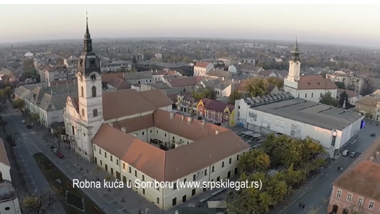
Robna kuća u Somboru