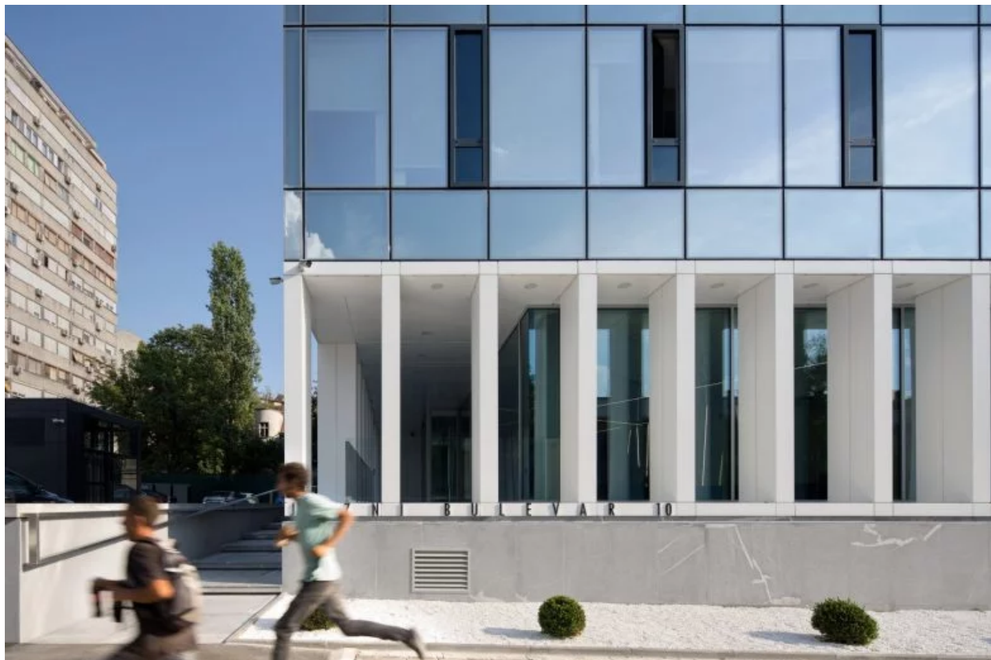
Poslovni objekat Roaming na Južnom bulevaru po projektu Gorana Vojvodića; Foto: Relja Ivanić

Zaštita životne sredine kroz ekološku, energetske efikasnu i održivu gradnju je jedna od najznačajnijih vrednosti koja se promovira kroz „Xella Triumph“ takmičenje. Koliko je taj aspekt danas bitan i koliko je on trenutno razvijen u Srbija?