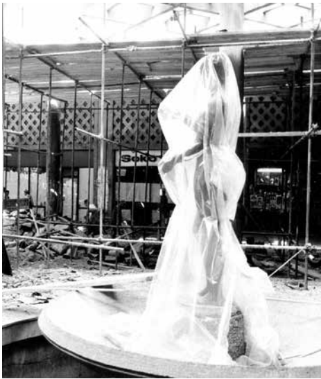
Слика 7 Владета Максимовић, Пролаз Безистан, Теразије, Београд, 1953; Реконструкција Безистана крајем осамдесетих година XX века.