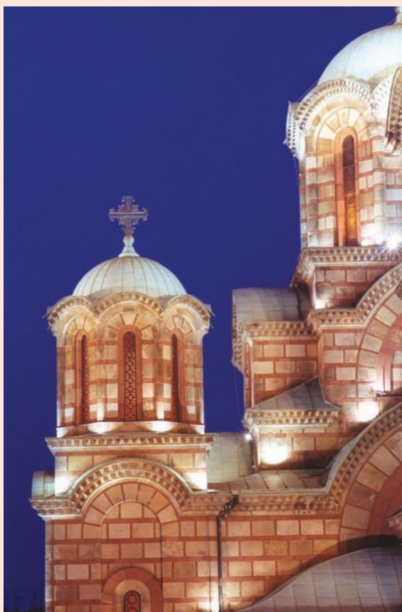
Сл. 4. Умерени контрасти Fig. 4. Moderate contrasts

усмерени, због чега се на одређеним деловима фасаде уочавају “светле флеке”.