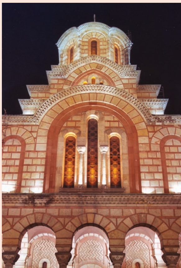
Сл. 5. Расподела сјајности у складу са ритмом фасаде Fig. 5. Luminance distribution in accordance with façade rhythm

Ритмичност фасаде и динамичност израза, које представљају основна обележја концепције објекта, истакнуте су тачкастим осветљењем, топлим бојом светлости која је компатибилна са топлим бојама фасаде, различитом сјајношћу на површинама различитог значаја и квалитета, као и разликама у осветљености у складу са ритмом фасаде (Сл.5). Праћење хијерархије вредности стилских елемената и истицање детаља у оквиру целине помоћу осветљења доприноси истицању архитектонске идеје и очувању духа цркве Св. Марка. Посебно осветљење купола, толико значајно код панорамског сагледавања