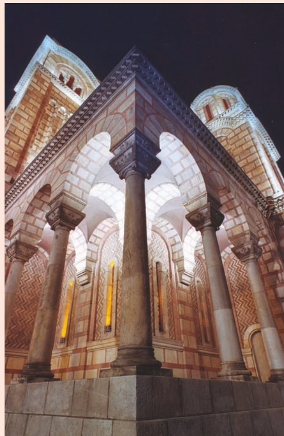
Сл. 3. Осветљење колонаде цркве Св. Марка Фиг. 3. Colonnade lighting of St. Marko's Church

Зона фасаде испод најнижих венаца није посебно осветљена, јер би рефлектори који би се користили у ову сврху изазивали непожељно бљештање у очима посматрача, а умањило би се и ефекат осветљења аркадног трема. Ова површина добија дискретну светлост од парковских светиљки распоређених дуж читавог обима цркве.