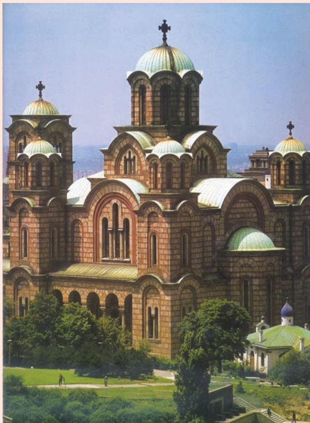
Сл. 2. Црква Св. Марка у условима природне светлости Fig. 2. St. Marko's Church in daylight