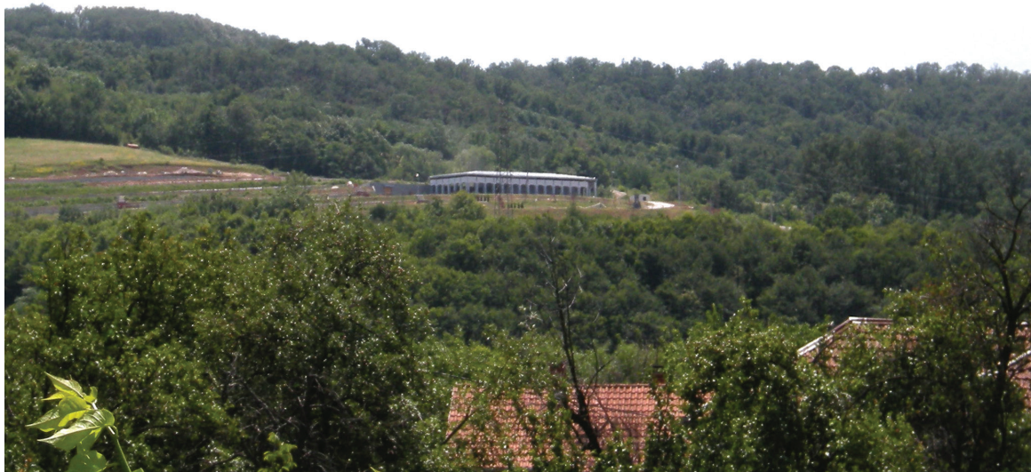
Сл. 1 Панорама

Ново гробље је смештено у отвореном пејзажу са капелом која доминира простором. Аутори су тежили сведености у изразу и читљивости намене, а покренутост терена је захтевала постављање гробних места и капеле са тргом за испраћај паралелно са изохипсама. Приближно на средини западног дела локације, на морфолошки истакнутом месту (гребену), формиран је централни простор новог гробља који чине плато за испраћај на коме се налази објекат капеле и меморијални простор који је предвиђен за премештање вредних спомен обележја. У оквиру овог простора је и парцела за осаријум – костурницу за смештај посмртних остатака са постојећег гробља за која нису утврђени стараоци. Иако је капела доминантан објекат, она својом величином не нарушава склад целокупног просторног решења. Полегла уз терен, са издуженом линијом уједначеног ритма стубова, одражава мирноћу и трајање. Кров је визуелно и конструктивно одвојен и „лебди“ над чврсто укопаним правоугаоним корпусом, чиме одаје утисак метафоричног издигнућа. Атмосфера око капеле и у простору трема је пуна ритмичких, променљивих сенки. Све ово доприноси утиску метафизичности и етеричности простора. Архитектура објекта је дијалог трајног и пролазног. Материјали су локални – дрво и камен из оближњег мајдана. „Акропољско“ место капеле јој даје додатну ноту духовности (Сл. 3).