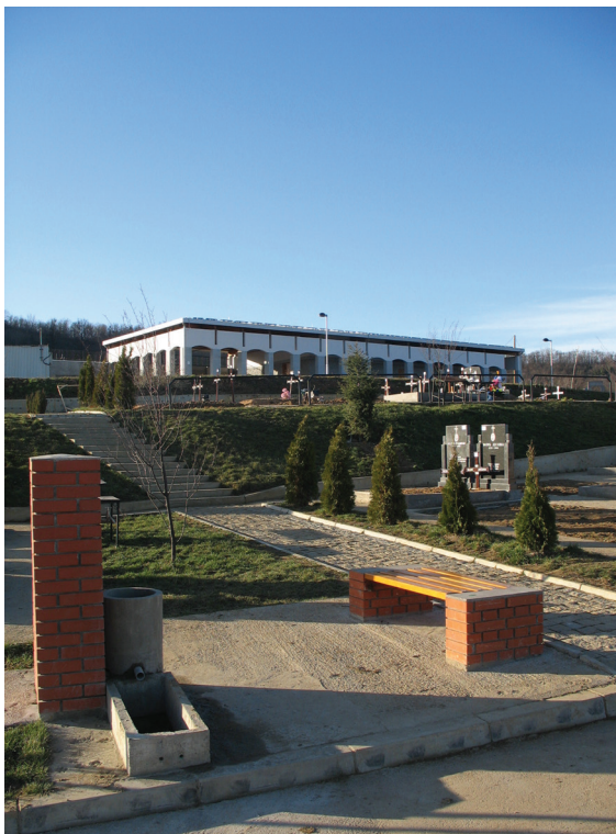
Сл. 3 Капела

Дуж главних колско-пешачких комуникација формирани су дрвореди којима доминирају врсте из категорије високих лишћара, као што су црвени храст, планински јавор, липа и бели јасен. Колско-пешачке комуникације су озелењене нижим врстама средњих и калемљених лишћара и четинара, као и простори предвиђени за одмор, где се налазе чесме и клупе. Овим просторима доминирају врсте као што су магнолија, питоми кестен, туја, храст лужњак, док су мање шкарпе озелењене магнолијом, багремом и јавором. На површинама где су шкарпе веће од 1,5m налазе се засади зимзеленог шибља и полеглих четинара као и листопадног шибља, а потпорни зидови су озелењени пузавицама.