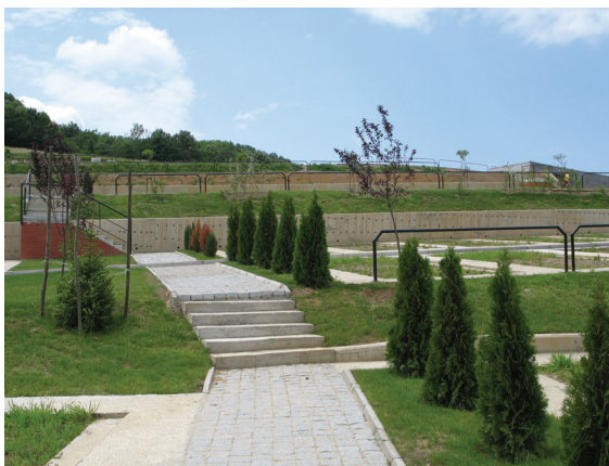
Сл. 5 Детал - стаза