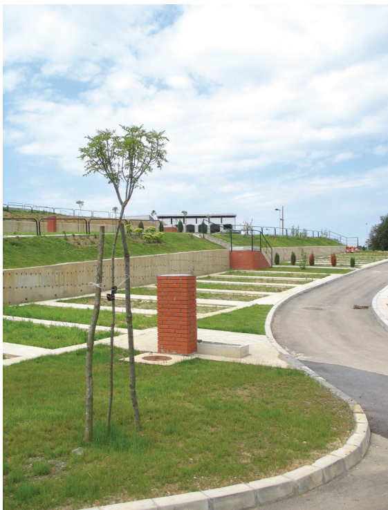
Сл. 4 Детал - чесма