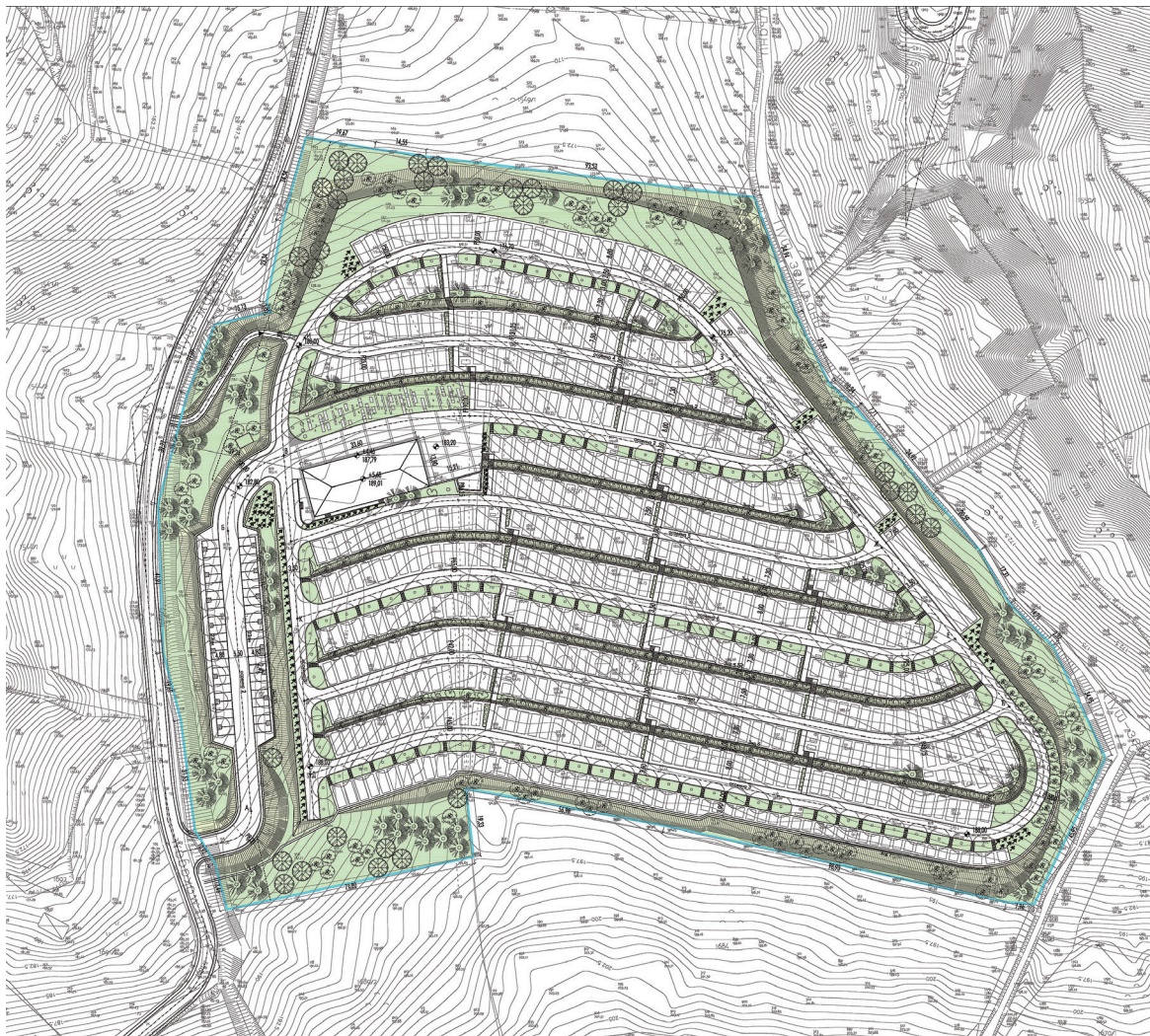
Сл. 6 Дендролошки план

Зеленим површинама меморијалног комплекса наспрам капеле, као и површинама око саме капеле, доминирају високи лишћари (црвени хрст, планински јавор, липа и бели јасен) и ружичњак, док су на површинама око капеле заступљени листопадно шибље, четинари и пузавице.