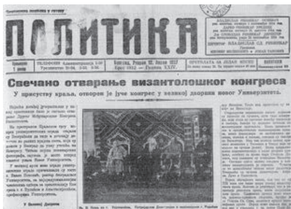
Сл. 4. Насловна страна дневних новина Полиџика 12. 4. 1927.