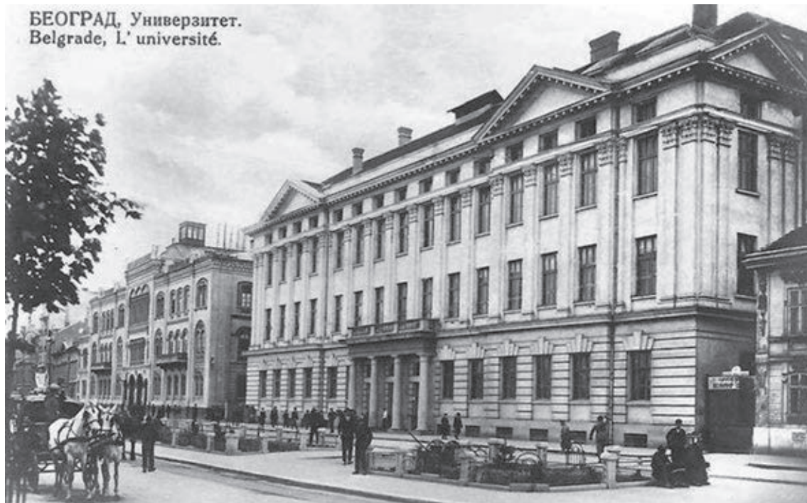
Сл. 2. Петар Гачић, Нова зграда Универзитета у Београду, 1922. (Разгледница с почетка 1930-их)

На пространом Краљевом тргу, испред универзитетских зграда стајали су Београђани, да виде и дочекају делегате из разних крајева света, који су дошли у Београд да узму