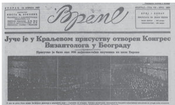
Сл. 5. Насловна страна дневних новина Време 12. 4. 1927.