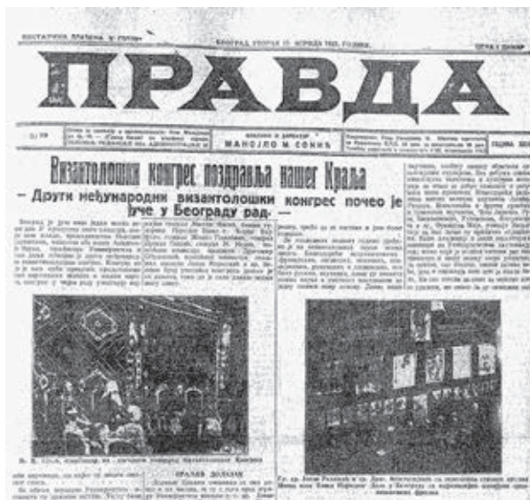
Сл. 3. Насловна страна дневних новина Правда 12. 4. 1927.

На једном подијуму застртом црвеним застиркама као византијским пурпуром постављено је пет фотеља: за краља, председника владе и највишег представника цркве. [...] Десно од краља сео је патријарх са белом