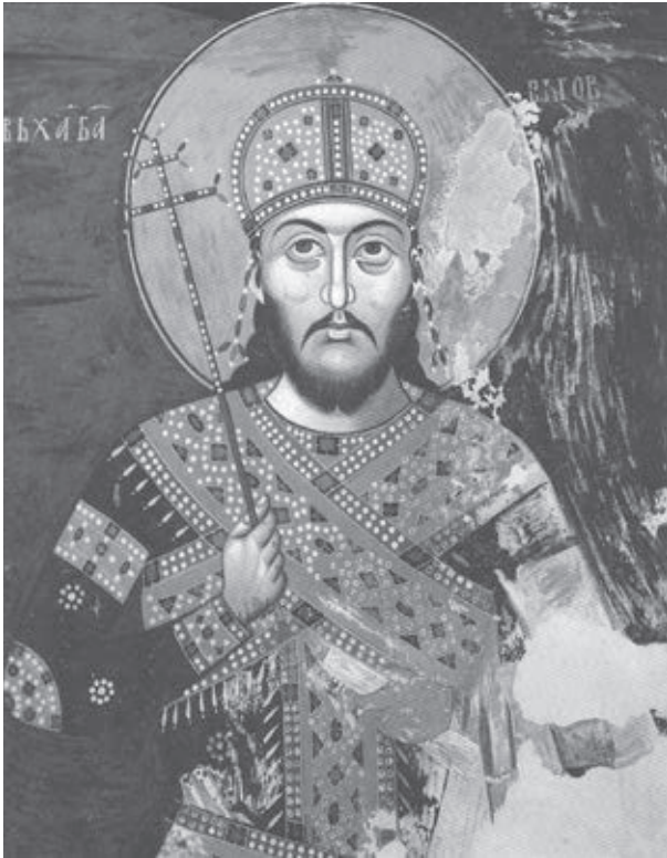
Сл. 6. Портрет цара Стефана Душана у цркви у Леснову, 1349. Фреска.