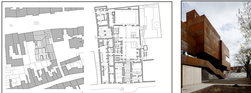
Слике 4,5 - Културни центар у Бад Радкерсбургу, Аустрија, Изглед, ситуација и основа приземља