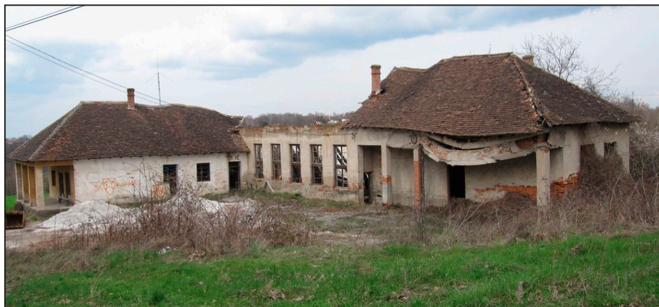
Слика 2 – Задружни дом у селу Шутци, Лазаревац