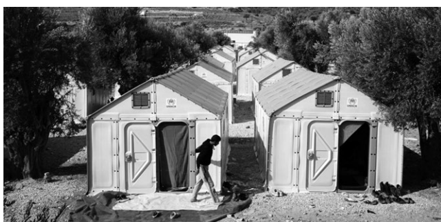
Слике 7. и 8. Могућа „брза“ решења за приватни смештај миграната

Можемо да закључимо да се Београд, за разлику од других европских градова, брзо прилагодио ситуацији и то на позитиван начин. Ипак, мигранти нису изабрали Београд за свој град, за своју дестинацију због тога што је недовољно атрактиван са економског станивишта. Векови искуства учествовања у непосредним ратним сукобима, конфронтацијама, проласка и прихватања миграната учинили су да Београд буде резилијентан 1 град са брзим и адекватним реакцијама.