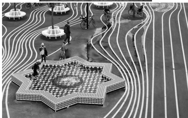
Слике 9. и 10. Парк Суперкилен (дан. Superkilen ) у Копенхагену: диверсификација