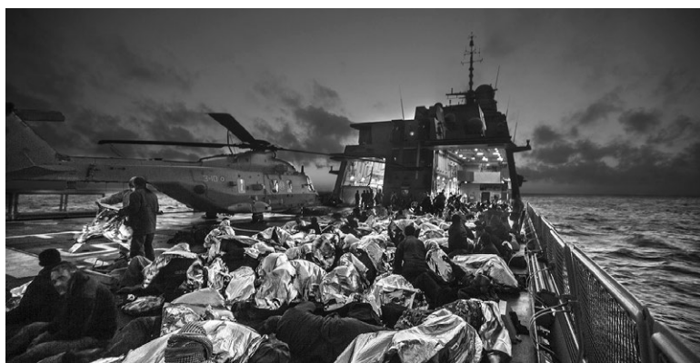
Слика 1. Италијански брод који је прихватио мигранте у Медитерану 2015. године

Миграције представљају, међутим, и даље велику непознаницу, односно тешко могу да се предвиде у пуном облику, те представљају значајни изазов за урбани развој. Њихова изненађујућа снага, као ових из 2015. године, затекла је неспремним како експерте који се баве миграцијама тако и искусне просторне планере, географе, социологе и политичке аналитичаре, без обзира на наговештаје и познавање политичких превирања на Блиском истоку, тј. препознавајући шире интересе великих сила.