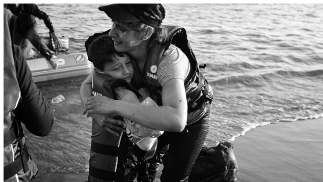
Слике 2. и 3. Типични призори миграната током 2015. и 2016. године који су виђани у дневној штампи

Исходиште миграција у 2015. години биле су земље погођене ратним сукобима и бомбардовањима, што Србија и те како може да разуме, па самим тим као нација исказује посебну емпатију. Покренути са Медитеранског подручја, са циљем да стигну у земље Шенгена, посебно у Немачку, у мањем опсегу у Данску и Шведску, мигранти су први фокус и тачку проласка пронашли управо у Београду и Србији. Београд је, стицајем географских околности, као вековна тачка сусрета Истока и Запада, а сада на путу од југа ка северу, постао важна међутачка ових миграција. Разлог миграција – небезбедност људског живота изазвана ратовима – од памтивека се сматра несумњиво оправданим узроком покретања и великих сеоба. Ипак, веома велики број миграната нико није могао да очекује, посебно што је од самог почетка сукоба на Блиском истоку прошло више од годину дана. Трагедија је досегла свој максимум у априлу 2015. године, када се, у покушају да се домогну грчке обале, утопило око 1.200 људи код острва Лезбос. Многе стратешке операције спасавања показале