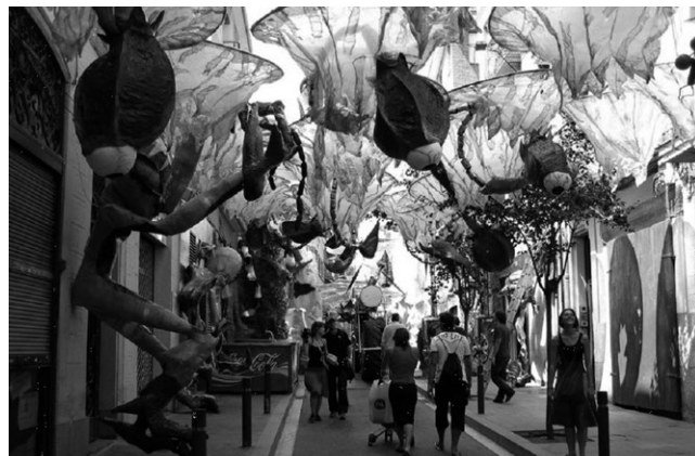
Слика 11. Нови, инклузивни простор у историјском језгру европског града

Јавни и полујавни простори се планирају са одређеном густином, мешаним функцијама, уобличеним улицама, пролазима и фасадама где се посебна пажња поклања активирању интензивног коришћења. Теоретски и практично, јавни простори треба да позивају на сусрет, и то на сусрет различитих група.