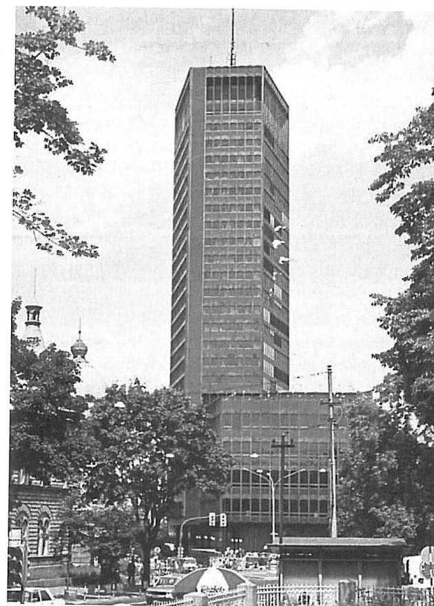
PALATA BEOGRAD, RAZGLEDNICA (1970-TE)

imena, ali radikalno drugačijeg ustrojstva i sistema vrednosti. Moderna arhitektonska koncepcija “Beograđanke”, sa tačkastim osloncima i armirano-betonskim jezgrom, fasadom u obliku zid-zavese koja svesno referiše na standardnu sliku američkog korporativnog nebodera, 11 kao i urbano senzitivnim i humanim parternim rešenjem, moraju se sagledati naspram rigidne kompozicije Palate “Albanije” i njene autoritarne arhitekture okoštalog i krutog “poznog modernizma”. U tom smislu, “Beograđanka” je neposedno učestvovala u ideološkoj ekonomiji razlike – kao središnjem mehanizmu konstruisanja novog jugoslovenskog identiteta. Međutim, u vreme kada je podignuta i Palata “Albanija” percipirana je kao građevina sasvim nalik “duhu američkih solitera”, 12 što otvara generalno zanimljiv problem tranzitivnosti i nestabilnosti značenja arhitektonskih oblika, te instrumentalnosti različitih graditeljskih tipova i formi u različitim ideološkim kontekstima.