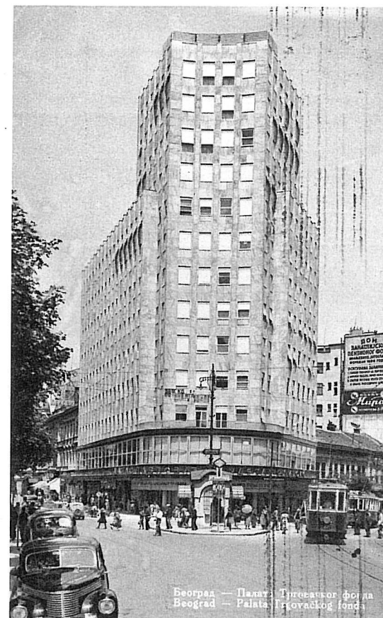
PALATA ALBANIJA, RAZGLEDNICA (1940)

Nema fascinantijskih primera ovog fenomena od visokih kula koje markiraju pomenutu centralnu beogradske osovine. To su Palata “Albanija” (1938-39) i Palata “Beograd” (poznatija kao “Beograđanka”; 1969-74). Kada je 1939. godine Hipotekarna Banka Trgovačkog fonda podigla Palatu “Albanija” – tako nazvanu po staroj kafani koja se na istom mestu nalazila sve do 1936. godine – Beograd je dobio ne samo najvišu građevinu na Balkanu, već i objekat u kome su se suticale arhitektonska i urbanistička vizija Terazija kao poslovnog i trgovačkog centra jugoslovenske prestonice sa grčevitom potrebom vladajućih elita da se simbolički poništi akutna politička i ekonomska kriza, koje su u predvečerje rata potresali inače krhku konstrukciju prve jugoslovenske države. Na mestu nekadašnjeg “higijenskog strašila” i “kulturne sramote za celu pre-