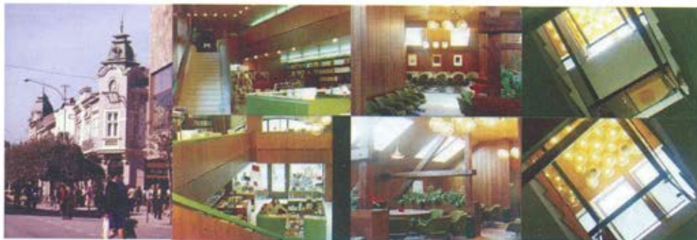
Слика 17. Дом књиге Просвета у Крагујевцу, 1978. година. Објекат је споменик културе. Обновљен је споља и реконструисан унутра ради организације нове функције. Решењем се постигла једнообразност свих функционалних целина светлосним и колористичким ефектима уједначених топлих тонова са извесним акцентима хладне боје. Осветљење је пратило функцију. Са вештачким светлом осветљени су пролази, вертикална комуникација, делови где се излаже и прегледа књига и где су лоцирани пунктови за информацију и продају. /аутор: Александар Радојевић/