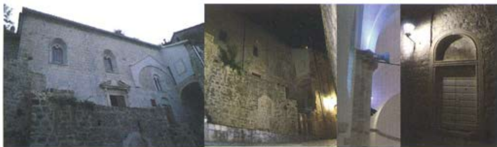
Слика 23. Црква Св. Павла у Котору, 2014. године. Споменик културе од изузетног значаја реализован је као комплекс „објекат као експонат“. Светлосна сценографија комплекса изведена је комбиновањем халогене и LED расвете која током ноћи на фасади наглашава портал романичке цркве из XIII века и фасаду са два готска прозора изнад улазног портала средњовековне цркве из XVI века. Унутар објекта реконструисани су остаци основе са апсидом Романичке цркве. Покривени су и заштићени стаклом на металној конструкцији, а приликом преласка посетилаца активира се осветљење. Усмереним светлом осветљавају се укрштена ребра сводова на плафону и пиласстри са капителима на зидовима. /аутори: Александар Радојевић и Никодин Жижић; аутор конзерваторско-реставраторских радова: Слободан Баришић/