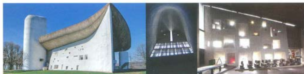
Слика 6. Капела у Роншану – Chapelle de Notre-Dame-de-Haut, Le Corbusier, Ronchamp. На објекту је истакнута моћ и снага дневне светлости која унутрашњи простор чини несвакидашњим. Атмосфери и свеукупној сценографији простора доприносе снопови природне светлости који пролазе кроз прозоре различитих облика и димензија. Зид постаје светлосна скулптура и доминира унутрашњим простором. Корбизје нам открива своју идеју када каже: „Основна мисао је била да се код посетилаца створи осећај блаженства, да се произведе духовно оздрављење и мир“