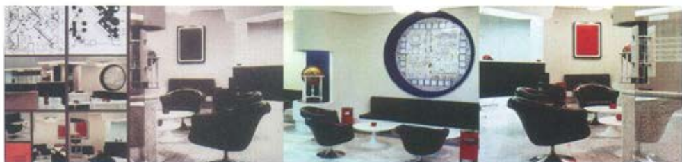
Слика 16. Туристичка агенција Путник у Београду, 1976. година. У односу на функцију простора дата је потпуна осветљеност, континуално индиректно светло изнад пулта и умерено светло на глобус света. /аутори: Зоран Петровић и Александар Радојевић/