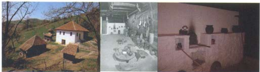
Слика 19. Родна кућа војводе Живојина Мишића у Струганику, 1987. година. Простор „куће“ централни мотив музеолошке поставке решен је организацијом и распоредом оригиналног покућства. Комбинацијом светла и говором, саопштава се историјска „прича“. Простор се доживљава потпуно осветљен или посебно усмереним светлом, на поједине делове целине. /аутор музеолошке поставке: Александар Радојевић/