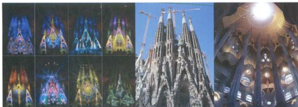
Слика 5. Саграда фамилија, Антони Гауди, Барселона. Архитектура Гаудија се базирала на фантастичној геометрији. Ефекат дневног светла, сенке и полусенке од изгледа објекта чине магичну игру светлих и тамних површина. Геометрија кривих и повијених линија које образују псеудо-магичне четвороугле највише се огледа у ритмичкој промени боја употребом вештачког светла кроз промену светлог и тамног контраста, топлог и хладног контраста или комбинацијом више контраста. Због природне светлости, која кроз прозоре улази у унутрашњост простора, створена је илузија као да се сунчеви зраци пробијају кроз гране. Преовлађује љубичаста светлост, која остварује осећај мира и спокоја [4]