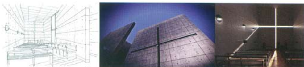
Слика 8. Црква светлости – Church of Light, Тадао Андо, Осака. Андо бетон користи да нагласи складну целовитост његове површине а не његове тежине. За њега: „Бетон је најпогоднији материјал за реализацију површина које су створене зрацима сунца, где зидови постају апстрактни, негирају се и приближавају крајњи лимит простора. Њихова присутност нестаје док простор који затварају пружа осећај реалног постојања“ [6]. Током време на светлост мења интензитет тако да крст, као елемент за изражавање идентитета функције објекта, постаје и најважнији детаљ спољне и унутрашње архитектуре [6]

ветљеног објекта, функционални аспект – заступљеност расвете код истицања карактеристика функције и колико се повезују или супротстављају међусобно површине на објекту, као и аспект енергетске ефикасности – контрола планиране расвете и њена употребна оправданост како не би угрозила аспекте естетике и функционалности, односно естетику и функцију објекта [7].