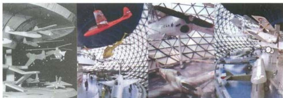
Слика 21. Музеј ваздухопловства у Сурцину, Београд 1989. године. Захваљујући транспарентном торусу велики је прилив природног светла. Сагледивошћу слетно узлетне писте аеродрома са нивоа поставке створена је илузија да су оригиналне летилице/експонати у „лету“. Осветљавају се усмереним осветљењем са галерије и са плафона. /аутор музеолошке поставке: Александар Радојевић/