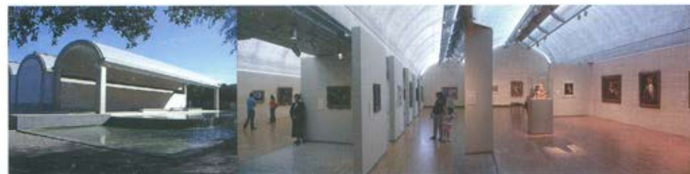
Слика 7. Музеј Кимбел – Kimbel Art Museum, Louis Kahn, Fort Worth, Тексас. Експонати су заштићени специјално пројектованим и изведеним подужним елементима на плафону, који природну светлост различитог интензитета индиректно рефлектују на њих, омогућавајући им да доминирају у неутралном простору музејске поставке [5]