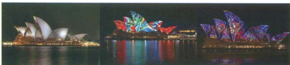
Слика 3. Опера у Сиднеју, Аустралија. Дело данског архитекте Јорн Уциона, проглашено за споменик културе и подигнуто у близини Сиднејског лучног моста, доживљава светлом потпуну трансформацију. Шкољке, битан елемент препознатљивости објекта, визуелно се трансформишу у једра, а плато на води и маса објекта стварају илузију трупа брода. Рефлексија светлости, одсеј на води и променљивост колорита светла и „шара“ на површинама шкољки, пружају чудесне изгледе.