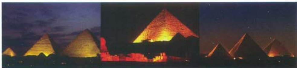
Слика 1. Египат, простор у Гизи. Умеравањем светлости из различитих углова на Кеопсову, Кефренову и Микериносову пирамиду истиче се њихов јединствен облик са нагласком хијерархије и колорита светла који одговара амбијенту песка и неба, као оптичке позадине, стварајући драматичне утиске код гледалаца.

Манифестација „Звук и светло“ ( Sound & Light ) као експресионистичко представљање односа облика и простора, одржава се на значајним местима у свету. На аутентичном простору, игром светла, звука и говором, симулира се историјска „прича“. Светлосни ефекти, промене светлог и тамног и стварање сопствене и бачене сенке облика у простору, утичу на промену сцене и простор се доживљава са пуно емоција и узбуђења (слика 1, 2 и 3). Или, религиозна церемонија Свети Огањ која се на Велику суботу очи Ускрса одржава на гробу Христа, испод куполе храма Христовог васкрсења на Голготи, у Старом граду у Јерусалиму (слика 4).