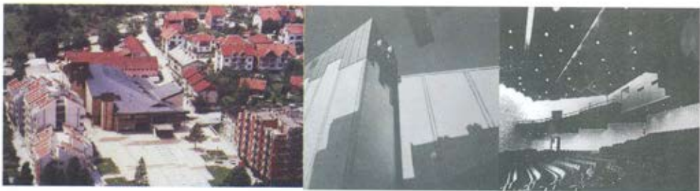
Слика 18. Дом културе са тргом у Ивањици, 1985. година. Сопствене и бачене сенке елемената склопа на фасадама објекта и простор, захваљујући светлости, образују интересантну игру светлих и тамних површина. Архитектура простора сале са вештачком расветом, индиректна расвета по обиму сале и усадне светилке на спуштеном плафону и плафону галерије, примерена је њеној поливалентној функцији а променљива је у зависности од различитих потреба на сцени. /аутори: Никола Саичић и Александар Радојевић/