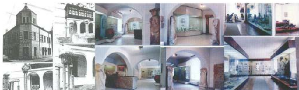
Слика 20. Музеј Крајине у Неготину, 1989. године. Заштита експоната од природног светла постигнута је постављањем специјално шпанованог платна, беле боје, испред прозора. Индиректна расвета нагласила је групе експоната у делу простора где нема природног светла, а код линијских витрина флуоресцентна расвета је обезбедила равномеран осветљај дво-димензионалних експоната. /аутор: Александар Радојевић/