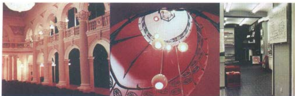
Слика 14. Студентски културни центар у Београду, 1971. године. Обновом спољњег изгледа и унутрашњег простора враћена је аутентичност објекту. Обновљена расвета главне сале са висећим кристалним лустерима који су набављени од истог произвођача, од Бакаловића из Беча, поново су истакли њен раскошни стилски ентеријер. Пратећи простори решени су са функционалном расветом и богатим упливом дневног светла. /аутори: Александар Радојевић и Зоран Петровић/