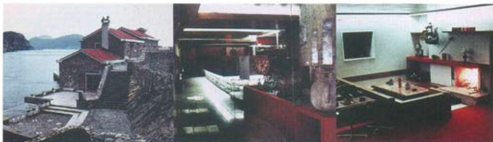
Слика 15. Лазарет и Кастело у Петровцу на мору, 1971. Година. Здања Лазарет и Кастело у Петровцу на мору, настали на измаку средњег века, својом визуелном посебношћу сликовито завршавају панораму мале Петровачке увале. Реконструкцијом комплекса спољњи простор је обновљен са свим карактеристикама приморске архитектуре. Расвета унутрашњег простора је реализована са индиректним вештачким светлом, а оплемењује се продором природног светла које „улази“ кроз постојеће прозоре на објекту. Светло је нагласило пролазе и функционалне зоне а задржало у полутами простор за одвијање програма. Централни мотив ноћног клуба је капетанска ложа са камином, окупљање око ватре, која исијава мекану светлост. /аутори: Зоран Петровић и Александар Радојевић/