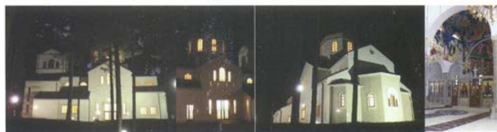
Слика 22. Црква Св. Преображења на Златибору, 2013. године. На „Српском Тавору израсла је једна успела форма само слична прошлости, а нових структуралних особина“ [12]. У вечерњим часовима, нарочито ноћу, истиче се ритмичност елемената склопа са наглашеним симболичким значењем. Количина природног светла, са отвора на фасади и из куполног простора, омогућила је унутар цркве посебну атмосферу стварајући јак контраст светло – тамно. /аутори: Боривој Анђелковић, Александар Радојевић и Милан Радојевић/