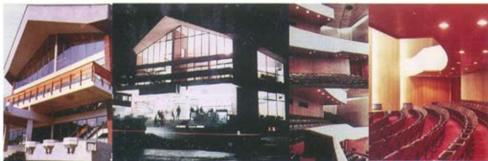
Слика 13. Дом културе са тргом у Новој Вароши, 1969. година. Повезивање спољњег и унутрашњег простора постигнуто је при дневној светлости истицањем облика примарних маса: јако истурених кровних равни, надстрешница над улазима, терасе хола сале и боје материјала, а ноћу вештачким светлом унутрашњих холова испред сале, сагледљивих споља захваљујући чеаној фасади, стакленом зиду. Плафон главне сале са индиректном расветом, обрађен у дрвету „оплемењује строгу експресионистичку ауру и повезује је са грађитељским наслеђем Рашког краја“ [11]. /аутор: Александар Радојевић/

/Слике од 13 до 23 представљају изабране објекте аутора, који без обзира на функцију и различите године изградње, својим изгледом показују стална настојања тима пројектаната за применом и употребом одговарајућег осветљења, наравно у тадашњим условима и степену расположиве опремљености код нас./