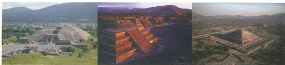
Слика 2. Мексико, простор у Теутихуакану. Изузетно организован и промишљено решен урбанистички комплекс са две истакнуте доминанте, пирамидом Сунца и Месеца. Причу о грађењу и народу тог поднебља прате променљиви зраци природног светла и тонално уједначени ефекти вештачког светла. Лепота сцене се доживљава у кретању и са крајњих платоа пирамида, несвакидашњи поглед на укупан простор са окружењем раван погледу из „лета“.