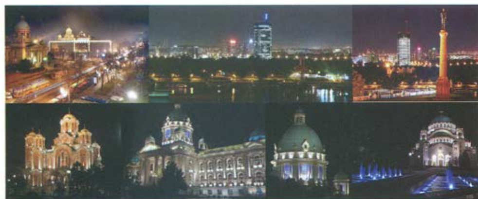
Слика 10. Београд ноћу. Београд је добио карактеристике великих метропола. Ноћни изглед Београда обogaћен је светлосном сценографијом његових истакнутих места и објеката као што су: зидине Калемегданске тврђаве, тргови, јавни објекти, споменици, истакнути градски симболи, мостовске конструкције, простори поред река.