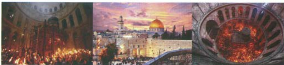
Слика 4. Свети град – Јерусалим. Храм Христовог гроба је централно место, жижа догађаја. Кроз специфичну атмосферу створену молитвеним појањем и пламеном свећа, кроз дим и продор природне светлости са куполе, одиграва се сцена Светог Огња. Природним светлом и исијавањем меке светлости свећа, фокусира се место церемоније.