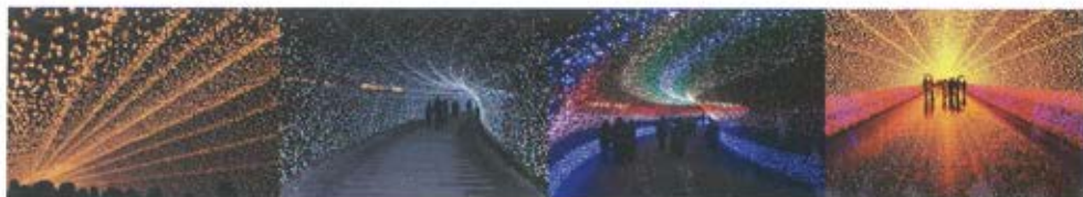
Слика 12. Осветљавање тунела у Јапану. Примери дневне светлости „тамо где није”.