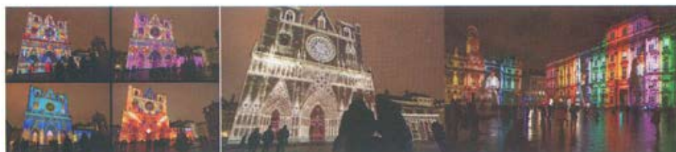
Слика 9. Фестивал светлости у Лиону. Један од најспектакуларнијих фестивала у свету. Град се претвара у велику светлосну позорницу. Приказана су најновија достигнућа у области осветљења и урбаног дизајна у свету. Истовремено сагледавају се тренутни домети архитеката, дизајнера, уметника, стручњака за светло и видео редитеља.