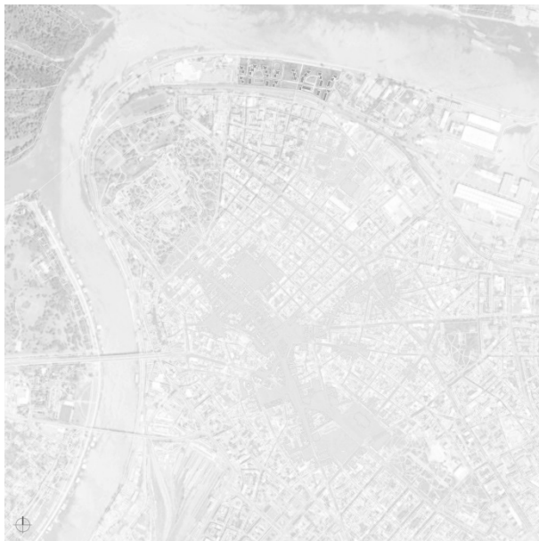
Слика 1. Приобаље Дунава: територија општине Стари град, Београд

Кроз студију случаја простора стамбене четврти на обали Дунава у Београду (слика 1) представљене су специфичности флуидности граница отворених јавних простора са аспекта флексибилности.