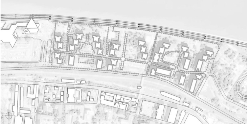
Слика 2. Јавни простор отворених стамбених блокова на Дорћолу