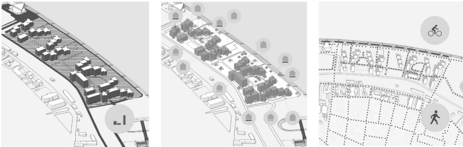
Слика 3. Стамбено насеље, Дорћол, Београд – приобаље реке Дунав: (а) отворени јавни простор; (б) стамбени објекти; (в) пешачке и бициклистичке трасе

Ови отворени јавни простори – простори заједнице , пројектовани су као простор намењен пешацима и бициклистима и представљају места на којима се одвија јавни живот насеља (слика 3). Овај вид саобраћаја сугерише: спорије кретање, застајање, окупљање и задржавање, комуникацију и интеракцију корисника међу собом али и са окружењем. Имајући у виду наведено, овај тип простора намеће захтеве безбедности и сигурности корисника како би се пројектоване активности несметано одвијале. Простори су адекватно уређени како би омогућили разнолике активности на отвореном. Простори заједнице, у времену настанка, промовисали су вредности активног односа међу корисницима и стамбених објеката који их окружују – културе становања, и обрасце модерног живота у великим стамбеним насељима.