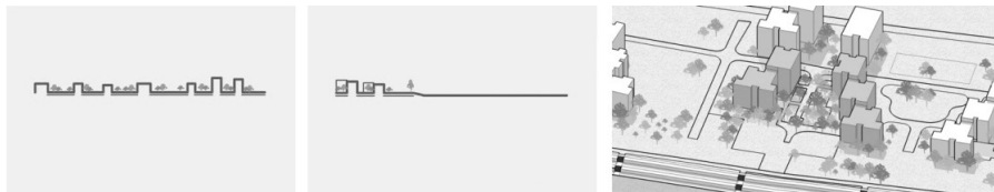
Слика 4. Дифузни карактер границе: (а) динамика изграђеног фронт према реци; (б) однос речног тока и изграђене структуре; (в) продор кроз изграђену структуру блока – комуникацијски токови

Зона одређена стамбеним објектима представља својеврсну границу између приобаља и града у залеђу, која има дифузни карактер. Отворени простори, који прожимају овај појас, представљају паузе у изграђеној структури и одликује их доминантно транзитни карактер. Комуникацијски токови, потенцирани потребом града да се приближи реци, уз асимилацију са изграђеном структуром, поспешују динамичко искуство простора. Имајући у виду наведено, може се закључити да су флуидни карактер границе и њена флексибилност испољени кроз својство пропустљивости посредством формирања транзитне пешачке трасе која омогућава приступ дунавском кеју (слика 4). Основни карактер овог подручја осликан је кроз дифузност подручја границе.