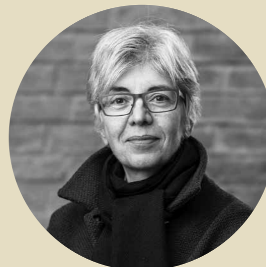
ДР ЉИЉАНА БЛАГОЈЕВИЋ АРХИТЕКТКИЊА

Werner Sobek is the founder of a globally active planning office with more than 350 employees. The company processes all types of buildings and materials. Special emphasis is placed on the design and planning of structures, façades , and technical building equipment as well as on consulting in building physics. The aim here is a built environment that is breathtakingly beautiful and at the same time meets the interests of future generations – Werner Sobek wants to build emission-free for more people and with less material.