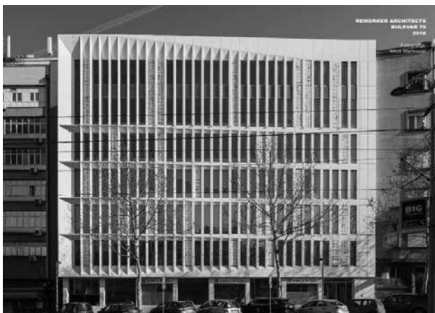
▶ Bulevar 79, REMORKER arhitekti / Boulevard 79, REMORKER architects