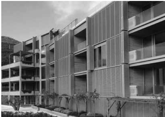
▶ Hotel „Kondo“, Kamenovo, Crna Gora / Hotel „Kondo“, Kamenovo, Crna Gora

ban planning, urban and architectural design, professional and scientific publications, as well as for the organization of expert consulting