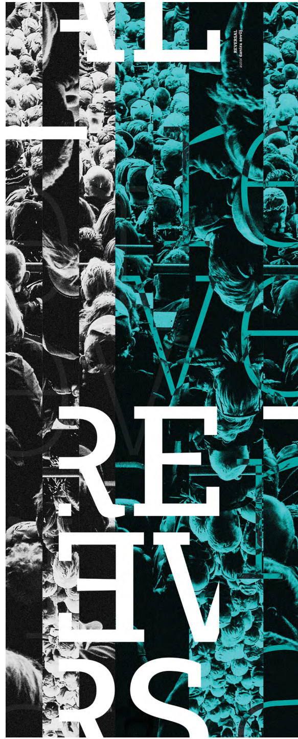
Данира СОВИЋ Reversal 40/100 cm | Дигитална графика | 2020