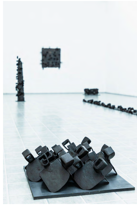
Милош ШАРИЋ Скулптура из серије Сви моји преци - КУЂЕ 22/66/66 cm | Варено гвожђе | 2020