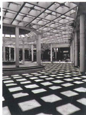
Љубица Штивич Безистан фотографија