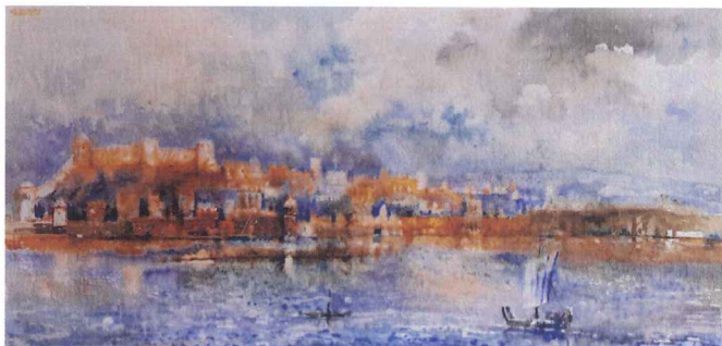
Предраг Тодоровић Ведута Сингидунама акварел