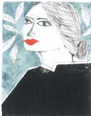
Татјана Трајковић Портрет дигитална графика