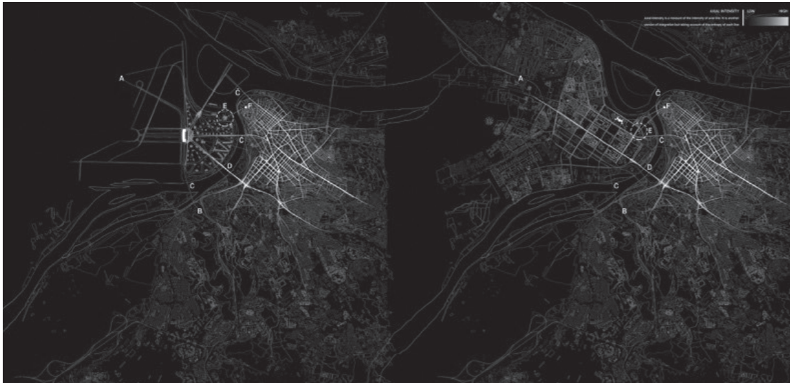
Слика 3. Синтезни цртеж

Ѓ - Позиција данашњег Бранковог моста претпостављена је и у Добровићевој скици, међутим иста предвиђа и железнички и друмски саобраћај. Данас се на мосту одвија само друмски саобраћај док се железнички, трамвајске трасе пре свега, одвија на старом Савском мосту поред, који није предвиђен скицом из 46те.