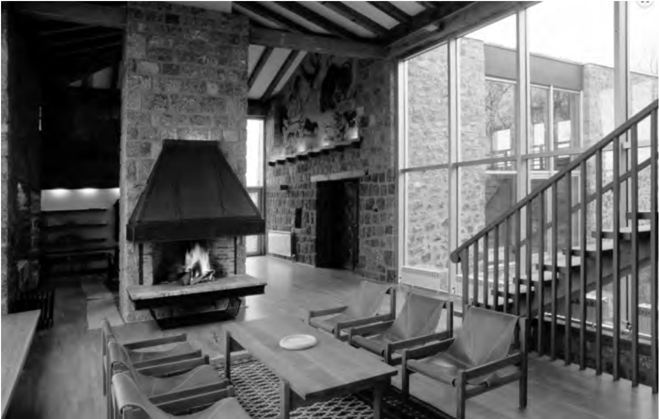
Слика 6. Кућа на Повлену, ентеријер

реперне тачке развоја архитектуре у руралним подручјима. Архитектура у суштини захтева дијалог са традицијом, са историјским вредностима и њиховим променама у времену, стварајући на тај начин аутентични облик неке нове уметничке експресије (Водопивец, 1990: 55).