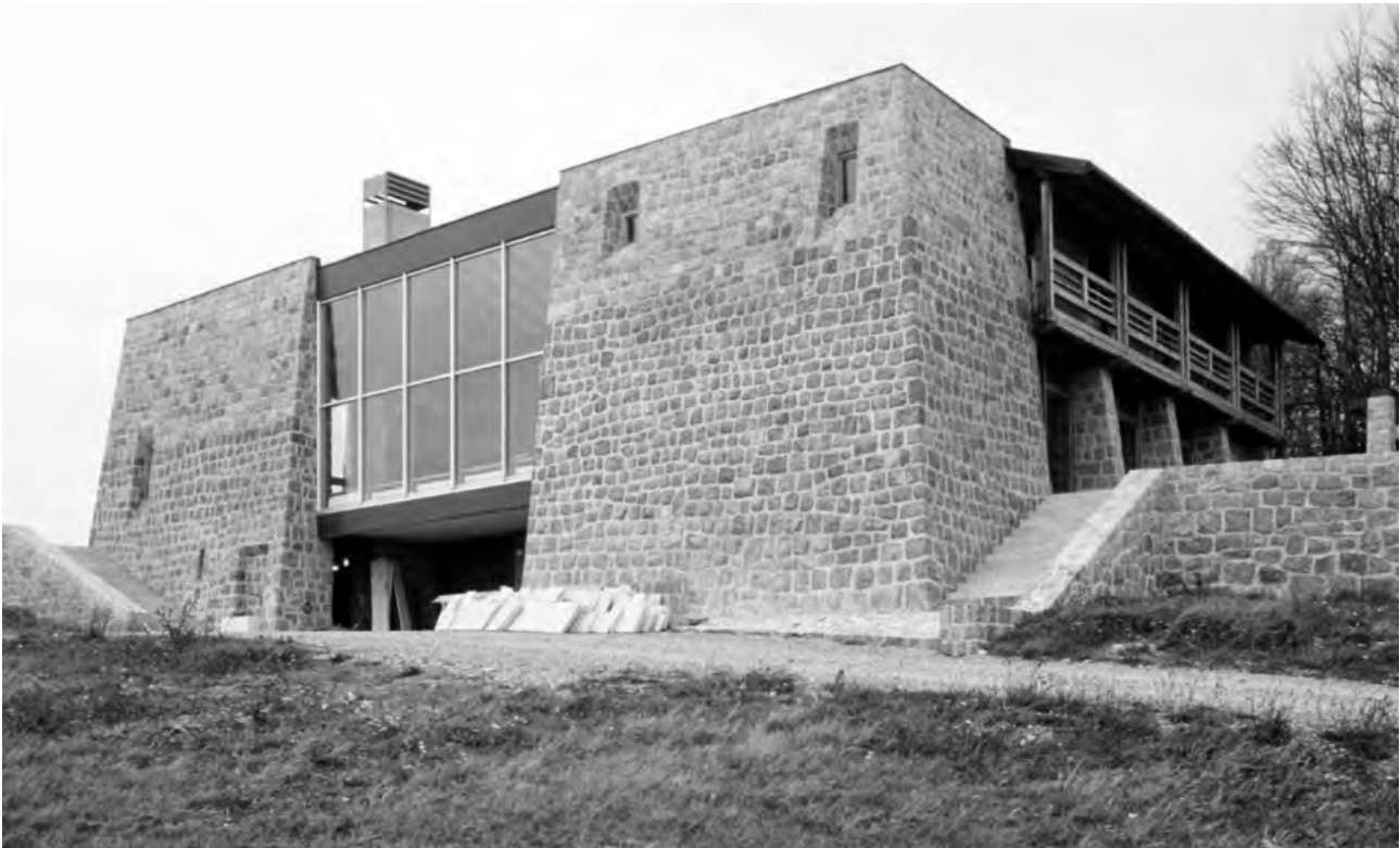
Слике 4, 5.- Кућа на Повлену, архитекта Благога Пешић

мено подстиче особеност његове архитектуре која је у сталној бојазни од западања у кич.