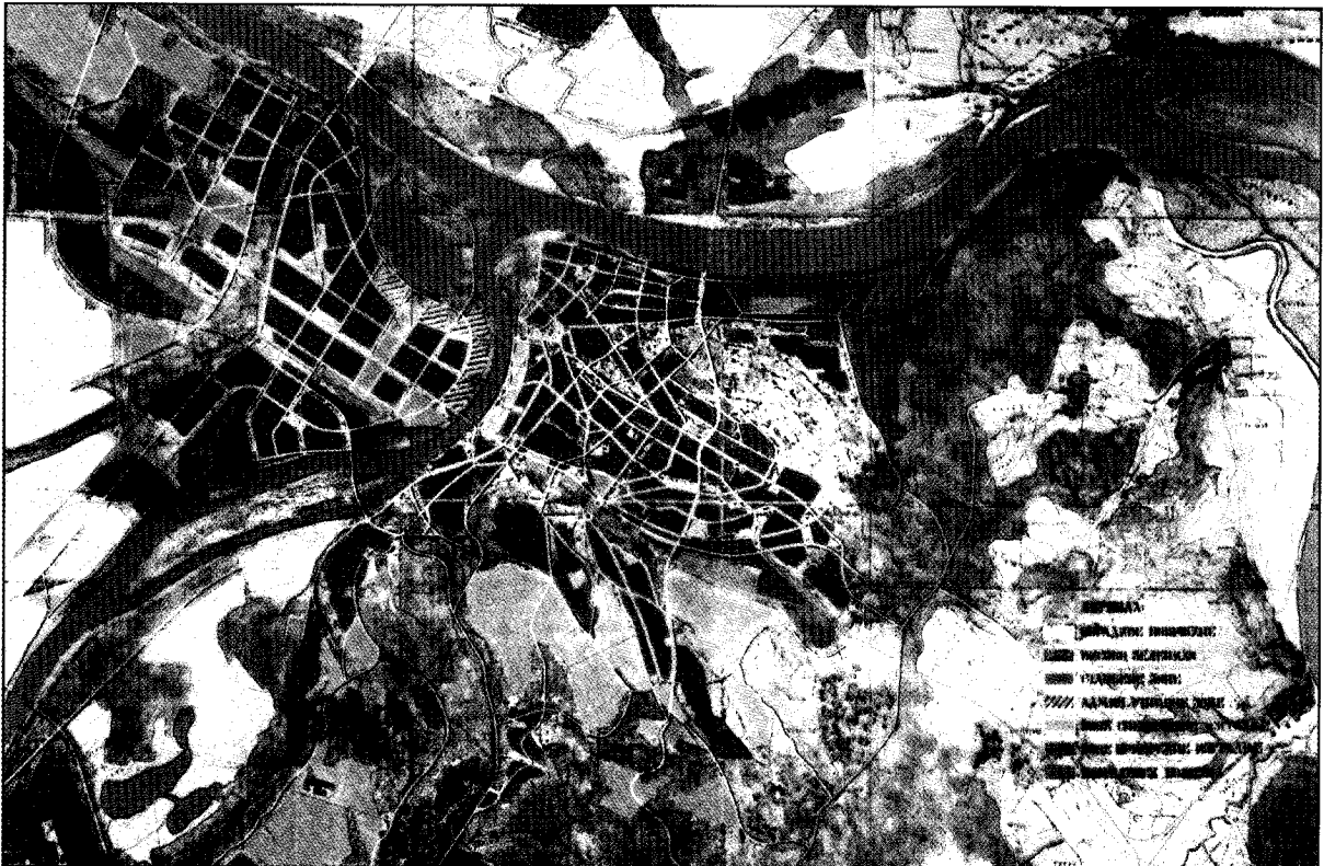
Сл. 1 ГУП Београда 1950.

Финансијски план за остваривање је урађен оквирно за рок од 20 год., од 1947. до 1966. Било је предвиђено да се реалан и детаљан финансијски план ради по етапама.