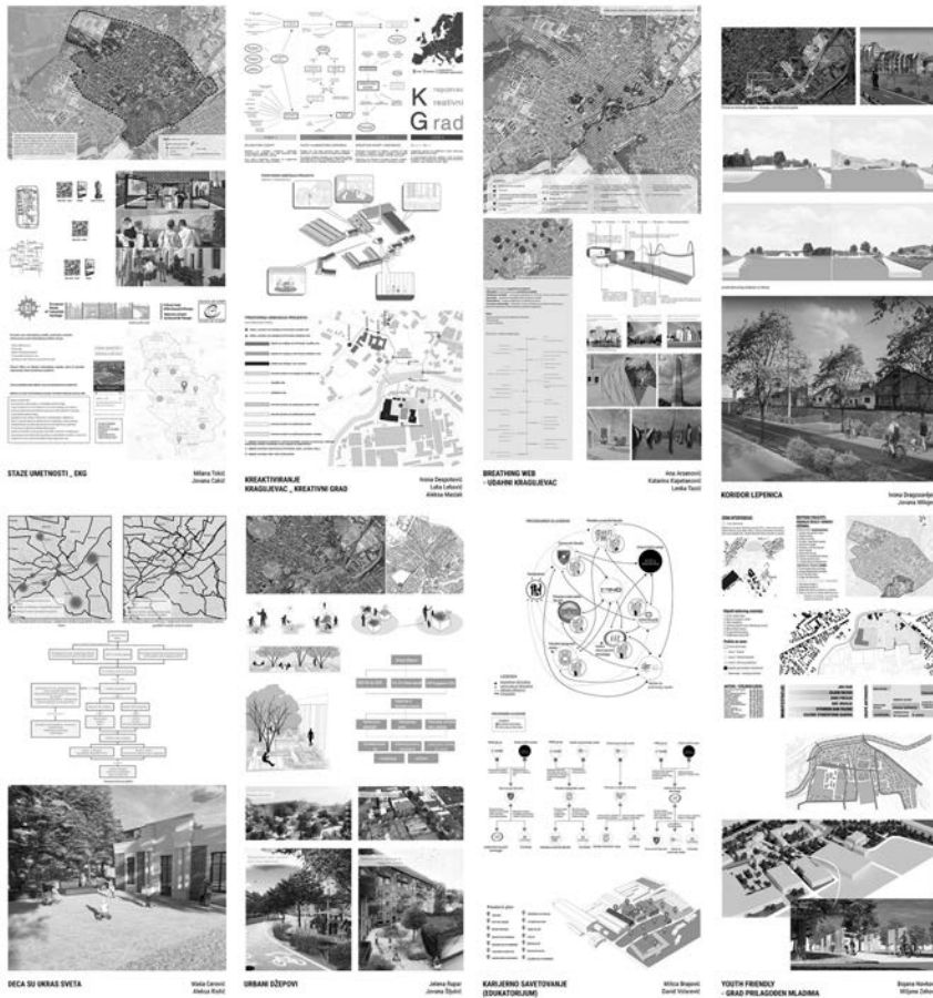
Slika 2 - Prikaz studentskih projekata