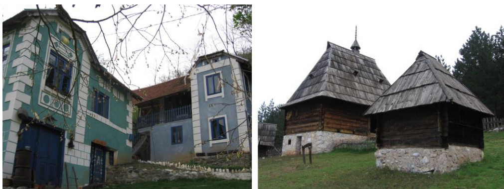
Slika 1- Moguće preuzimanje savremene funkcije repernih tačaka - vizitorskih centara u svom okruženju: Etno domaćinstvo (dvorište) Latkovac kod Aleksandrovcia i Muzej na otvorenom – Staro selo u Sirogojnu, formirano od sačuvanih i prenesenih vernakularnih objekata.

Ruralna područja u tom domenu poseduju ogroman potencijal pre svega zbog svoje prirodne i kulturne raznovrsnosti. Pod pojmom „ruralno“ mogu se definisati vangradske oblasti, pa i gradski areali, čija su osnovna fizička i geografska svojstva determinisana u okviru korišćenja zemljišta za poljoprivrednu proizvodnju i šumarstvo.