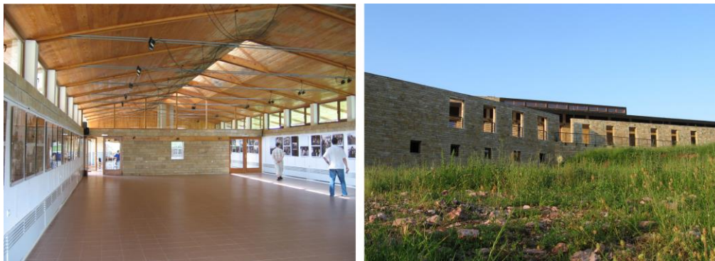
Slika 5: Spomen dom na Ravnoj gori (autor arh. Spasoje Krunić), na istorijskom lokalitetu, sa osnovnim (informaciono – prezentacionim) i minimalnim sadržajima noćenja i boravka

I konačno, ukoliko bi vizitorski centar bio lociran uz neke od specifičnih sadržaja uslovljenih okruženjem, npr. vinogorjem, morao bi sadržati i manji proizvodni pogon (vinariju) u cilju prezentacije proizvodnog procesa i čuvanja vina, zatim prostore za prezentacije i degustacije, odnosno komercijalno prodajni deo. To opet povlači i potrebu za restoranima posebne vrste, tavernama, konobama i sl. U zavisnosti od ambicije, investicione isplatljivosti i zarad atraktivnosti i ekskluzivnosti, ovakve objekte je uvek moguće nadograđivati (obogaćivati) dodatnim sadržajima, koji će se razlikovati samo po specifičnosti okruženja koje treba da promovišu i odluke investitora do kog nivoa ulaganja i opremljenosti prostora treba ulagati.