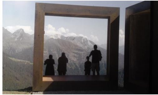
Slika 3 - Primarne vizitorske tačke: Pogled ka Perućaćkom jezeru sa mesta "Markov kamen" na Tari (iz monografije "Drina" – Zavod za udžbenike i nastavna sredstva – Beograd), i Vidikovac Timmelsjoch – Austria/Italy (Architect WernerTscholl) uz stajalište na litici pored puta (časopis C3 no. 359/2013.)

Uočavaju se dva osnovna tipa vizitorskih centara. Prvi predstavljaju pojedinačne informacione prostorne sadržaje (info punktove), koji isključivo služe da pruže potrebna obaveštenja i dodatna saznanja posetiocima o predmetnom lokalitetu. Drugi predstavljaju višenamenske fleksibilne strukture, i za razliku od prvog tipa, pružaju dodatne različite mogućnosti: od edukacije, smeštaja, rekreacije, muzejsko - galerijskih postavki, organizacije skupova, pa do prezentacije proizvodnih procesa, degustacije proizvoda i komercijalnog dela njihove prodaje i plasmana (npr. vinogorja i vizitorski centri u okviru njih). (Stovel, H. 2003)