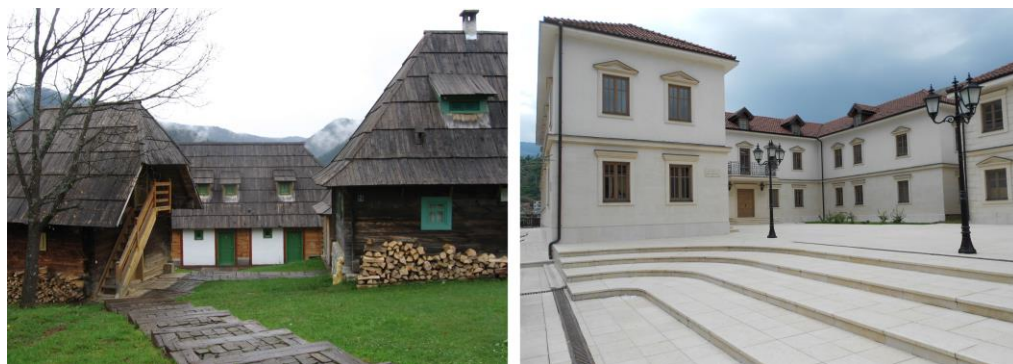
Slika 2 - Nova etno naselja, kao vid vizitorskih centara sa bogatim sadržajima: Drvengrad - Mećavnik u Mokroj Gori na Tari i Kamengrad – Andrićgrad, na reci Drini – Višegrad / RS)

Fenomen izgradnje čitavih novih naselja, poput Drvengrada u Mokroj gori i Kamengrada u Višegradu (Republika Srpska), samo potvrđuje izuzetnu potrebu za sadržajima ovog tipa. Ova dva slučaja su tipični primeri formiranja celina koje se mogu nazvati i tretirati kao vizitorski centri u pravom smislu reči. Osim što svojim urbanističko – arhitektonskim rešenjima uvažavaju tradiciju i podneblje u kome su formirani, oni svojim ostvarenim funkcijama predstavljaju magnet za posetioce, koji sa novim elanom dolaze u te prostore, upoznavajući i šire okruženje i sadržaje oko njih. Višegrad sa starim čuvenim mostom, nije više imao privlačnu moć za posetioce, koji su prolazeći kroz ovaj grad već videli čuvenu ćupriju na Drini. Novi grad – vizitorski centar, novi je motiv za ponovno posećivanje i unapredjenje šireg okruženja. U njemu se pored bazičnih (kratak ili duži boravak, trgovina, usluge) mogu zadovoljiti i složeniji zahtevi posetioca u kulturološkom, edukativnom i saznanom smislu. (Zbornik, 2004)