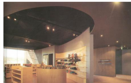
Slika 4 - Vizitorski centar sa osnovnim informaciono – prezentaciono – uslužnim sadržajima (Visitor center, Karijini – Australia, Architects: Woodhead International)