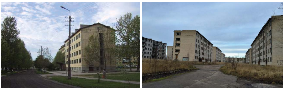
Слике 11 и 12: Потпуно празна стамбена зграда у градићу Палдиски, западно од Талина (Естонија) као некадашњем седишту за подморнице у доба СССР-а и сличан пример из градића Скрунда из Летоније.

У случају Грчке празни станови су новост; у случају балтичких држава - Литваније, Летоније и Естоније - празни станови су део свакодневице већ више од четврт века. Све ове државе су од пада комунизма 1991. године изгубиле преко 20% становништва. Ово се веома одразило на урбани развој, пошто су готово сви градови добили одлике градова у опадању , а у случају појединих градова пад у броју становника током поменутих четврт века је био и за 1/3. Најозбиљнији су примери градова са великим уделом руског становништва, које је масовно мигрирало. Поједини градови са угашеним делатностима одбране некадашњег армије СССР-а су данас буквално „ градови-духови “.