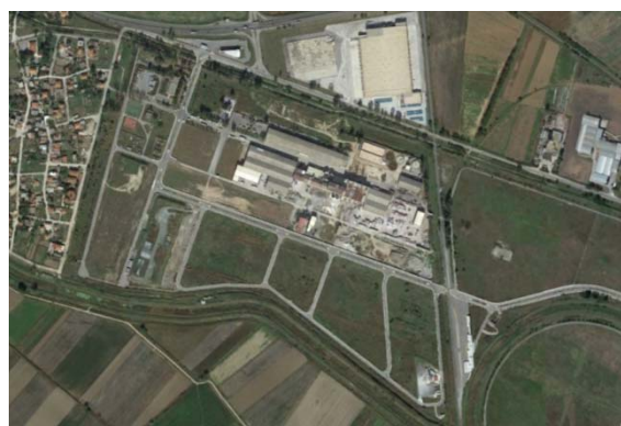
Слике 9 и 10: „Замрзнута“ станоградња на примеру олимпијског села у Атини и запуштени простори планираног ширења стамбених целина на примеру Солуна