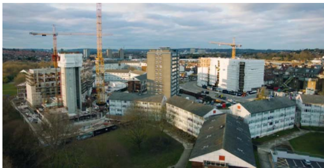
Слика 1: У Оксфорду је становање још већи луксуз него у Лондону ; Слика 2: Некадашње стамбено насеље под ударом нове изградње много већих густина, а мњег квалитета у урбанистичком смислу.