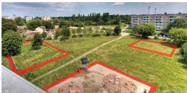
Слика 3: Берлин је очувао доступно становање кроз „паметну“ стамбену политику; Слика 4: Многи градови у источном делу Немачке имају проблем са опадањем становништва, па примењују уклањање непотребног стамбеног фонда, стварајући нове зелене површи.

Пример Берлина, који у себи садржи делове и једног и другог историјског развоја, уз јасна обележја становања у великом граду, је посебно илустративан. Он управо показује како се кроз „паметно“ управљање становањем могу посредно постићи добити у општем урбаном развоју. Услед овог приступа, изнајмљивање стана у Берлину је у просеку 8-9 пута јефтиније него у Лондону, тј. око 500 евра за двособан стан (Kamradt, 2015). Ипак, и у Берлину су