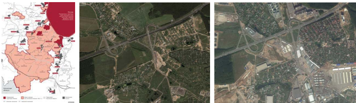
Слике 5, 6 и 7: Приказ нових подручја у оквиру града Москве и упоредни приказ ширења површина под новим становањем – стање 2003-2015.

Ипак, највећи број купаца су домаћи купци, а улагања у становање су махом усредсређена на велике градове , посебно Москву и Санкт Петербург, као и на њихова брзо растућа предграђа (UR, 0215). Како се држава и локалне власти боре са недостатком стамбеног простора овде? На најједноставнији начин – ширењем површина под становањем , што је могуће у држави која има малу густину насељености и доста слободног простора. Ово се ради на два начина. Пример за први начин је сам Град Москва , која је 2012. године проширила градско подручје за више од половине, добијајући нове слободне просторе за преко потребно становање. Тренутно се две метро-линије граде у правцу нових стамбених подручја на југозападу града, како би опслужиле очекивани нагли пораст становника.