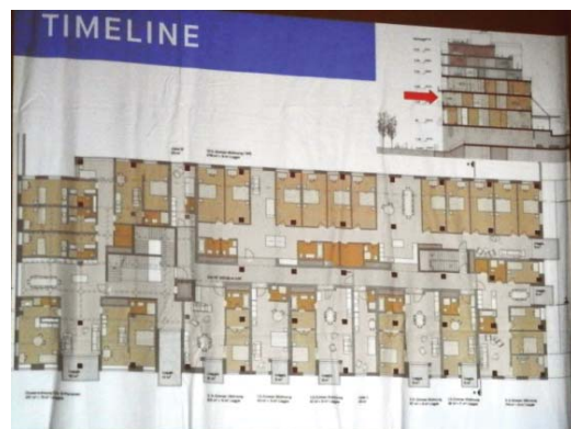
Слика 8: Нови станови, као овде приказани из Берна, су толико скупи, да их средњи слој у Швајцарској не може купити (лична архива аутора); Слика 9: Пројекат нове стамбене зграде у Берну са „комуналним становима“ као одговор на стамбену кризу (лична архива аутора).