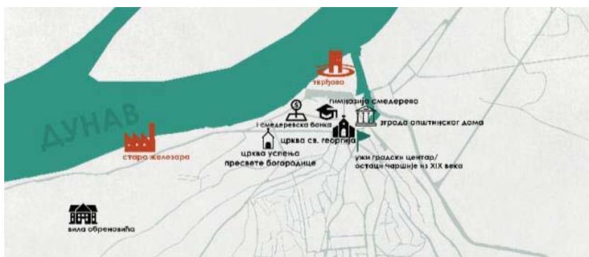
Сл. 3: Непокретна културна добра Смедерева, у оквиру градског подручја. (Аутор: М. Давидовић)

Специфична троугаона основа тврђаве утицала је на даљи развој урбане матрице Смедерева. У регулацији градског језгра можемо увидети изражену триангулацију, где су важни просторни елементи, попут Трга Републике, јасне троугаоне основе. Центар града такође обилује, како стамбеним зградама тако и грађевинама јавне намене, које представљају битан део архитектонског опуса града. Према ППГС-у град поседује много непокретних културних добара. Међу њима су бројне цркве, зграде јавних намена, историјски и археолошки комплекси, али и индустријске зоне. На слици 2. је приказан просторни размештај културних добара на подручју града, са нагласком на приобални појас.