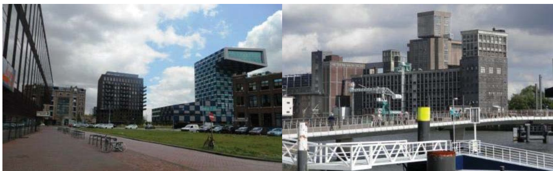
Сл. 1 и 2: Урбана регенерација браунфилда на примеру старе луке Ротердама у нове креативне четврти