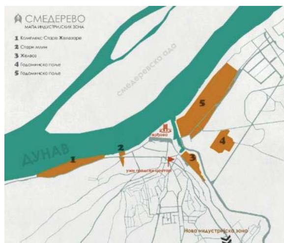
Сл. 4: Мапирање индустријских зона на подручју Смедерева. (Аутор: М. Давидовић)