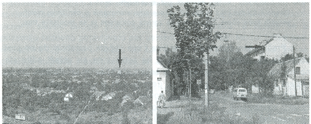
Sl. 3. Železnička kolonija kod Zemuna.

Takozvani neseljaci (administrativci, trgovci, radnici, poštari, policajci učitelji, lekari, veterinari i još mnogo njih), morali su biti privučeni stanom i obezbeđenom egzistencijom (nagrada u vidu veće plate), kako bi u opštem trendu satanizovanja sela kao sredine, pristali da žive i opslužuju seoski živalj. Korisnici društvenih stanova opet, iste dobijaju na korišćenje za vreme službovanja u nekoj od uslužnih delatnosti, ali se to najčešće pretvara u praksu trajnog korišćenja, sa pravom nasleđstva, čime se deo seoskog stanovništva pretvara u ruralne žitelje gradskog tipa. Privremenost njihovog boravka na selu i gradske navike koje su donosili sa sobom u ove nerazvijene sredine, bio je dovoljan razlog da im se kao stan ponude objekti i stambeni prostor neprimeren selu, bez dvorišta i radne alternative.